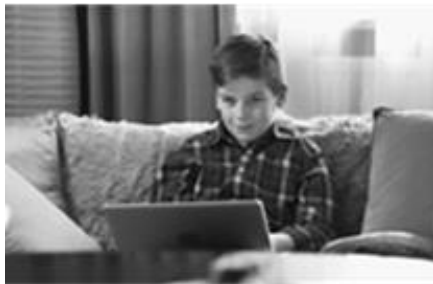
Rys. 1. Dobra Szkoła MEN – programowanie

Coraz większa oferta online różnego rodzaju pomocy dydaktycznych z zakresu nauki programowania, odpowiada chociażby na zmiany wprowadzone przez Ministerstwo Edukacji w ramach ostatniej reformy systemu oświaty. Od września 2017 r. elementy programowania są stałym elementem kształcenia już od I klasy szkoły podstawowej, a od klasy IV zwiększona została liczba godzin informatyki.