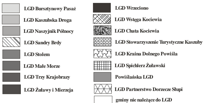
Rysunek 1. Rozmieszczenie Lokalnych Grup Działania na terenie województwa pomorskiego