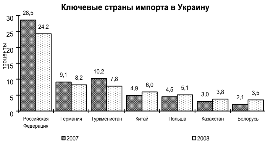
Рис. 2. Основные страны импорта товаров и услуг в Украину (составлено по данным [www.ukrstat.gov.ua])

Взаимная заинтересованность в развитии торгово-экономических отношений обусловлена широким спектром факторов, среди которых следует назвать территориальную близость, существующую и потенциальную емкость внутренних рынков, маркетинговую подобность вкусов, потребностей и приоритетов потребителей, а также геополитический