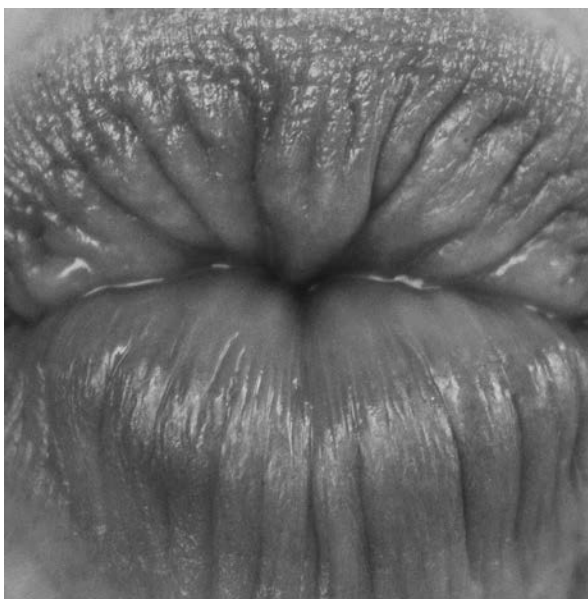
Katarzyna Bąk, Dopełnienia , zestaw 5, 2017, fotografia cyfrowa, 20 × 20 cm, fot. z archiwum konkursu

Aparat fotograficzny jest moim wieloletnim towarzyszem podczas codziennych zajęć, spacerów, a przede wszystkim podróży. Rejestruję nim ulotność chwil, pozornie nic nieznaczące detale, zmienne zachodzące w naturze, a najogólniej – wszystko, co wzbudzi moje zainteresowanie. W ten sposób powstało osobiste archiwum, będące zapisem moich obserwacji i emocji. Powracając często do swoich zdjęć, przeglądając je wielokrotnie, zaczęłam odnajdywać w poszczególnych fotografiach pejzażu, roślin i obiektów pewne podobieństwa do aktu. Moje obserwacje skłoniły mnie do rozszerzenia zbioru o fotografie