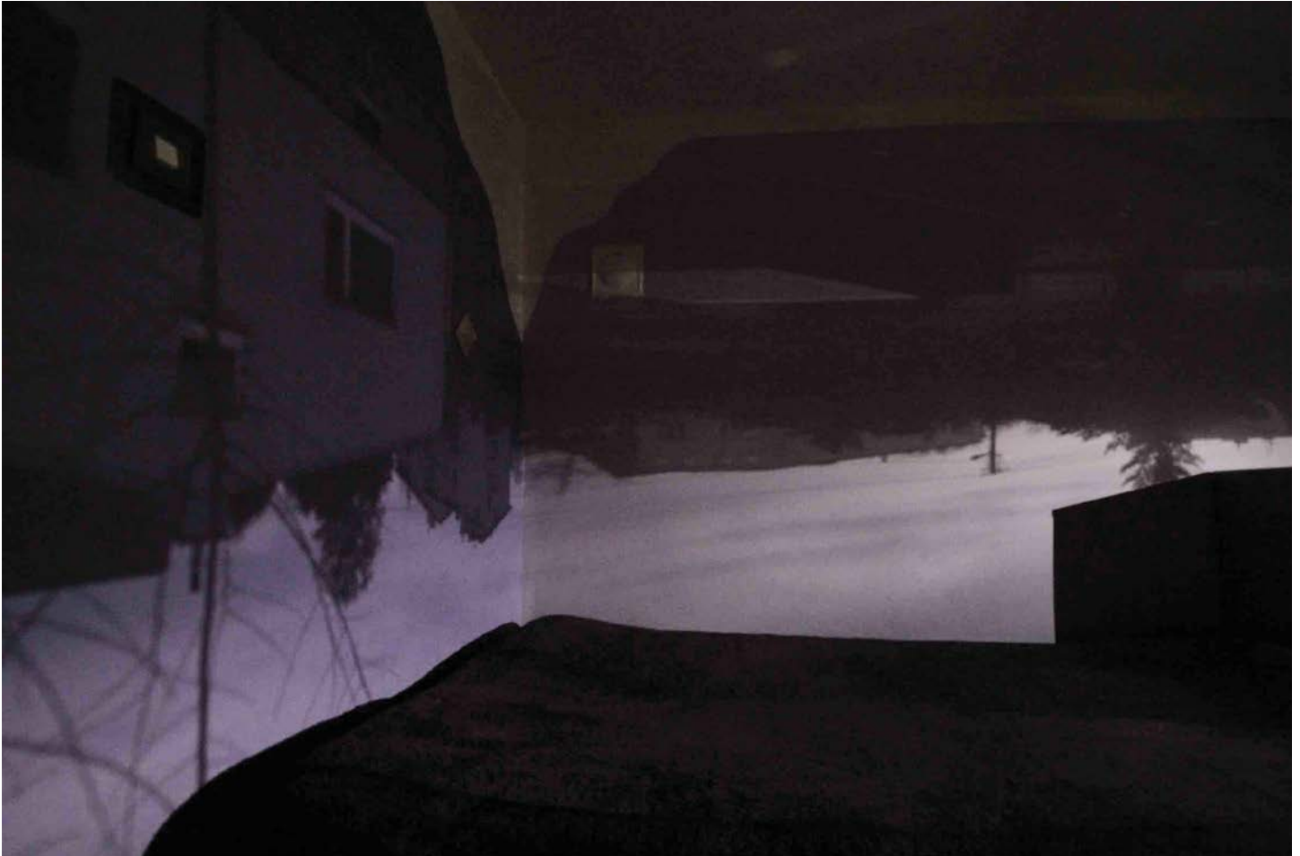
Łukasz Kuśnierz, Obraz zamknięty , 2016/2017, druk pigmentowy, 70 × 100 cm

to od prawdy, że udało mi się sfotografować wewnątrz aparatu. Fotografia w fotografii czy aparat w aparacie? Oba te stwierdzenia nie przekonują mnie i nie mają sensu, jeśli zagłębić się w to, co chciałem przekazać. Sprowadzenie fotografii do minimum i udowodnienie, że samo światło już potrafi tworzyć bez ingerencji człowieka, było dla mnie priorytetem. Musiałem wykazać tylko, że otaczają nas obrazy wszędzie i nie zdajemy sobie z tego sprawy.