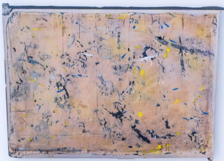
ATLAS / technika mieszana, płyta gipsowa, 41x56

Wyróżniona praca w katalogu Atlas / technika mieszana, płyta gipsowa.