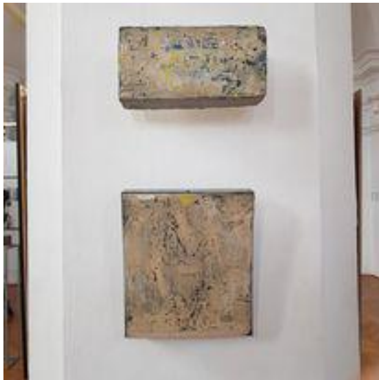
Prace na wystawie.