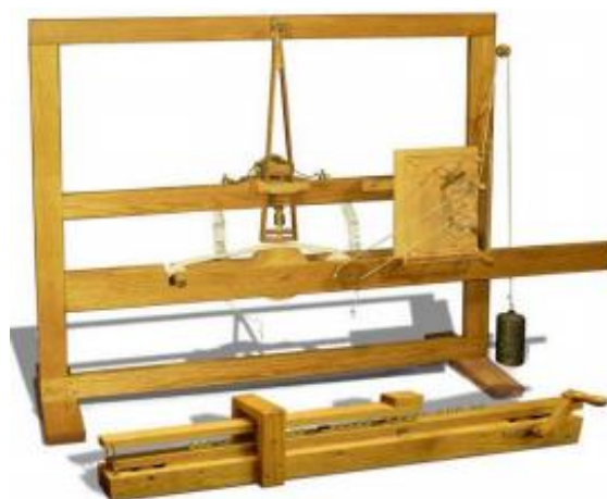
Rysunek 2. Telegraf Morsa