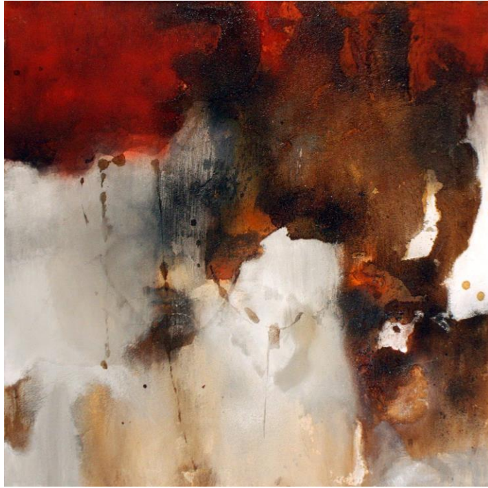
„Zwiastun I”, 60/60cm, 2018 r