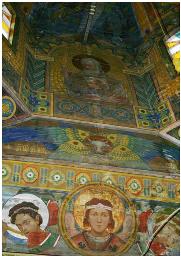
10. Modest Sosenko, św. Ewangelista Łukasz , cerkiew św. Zmartwychwstania we wsi Polany