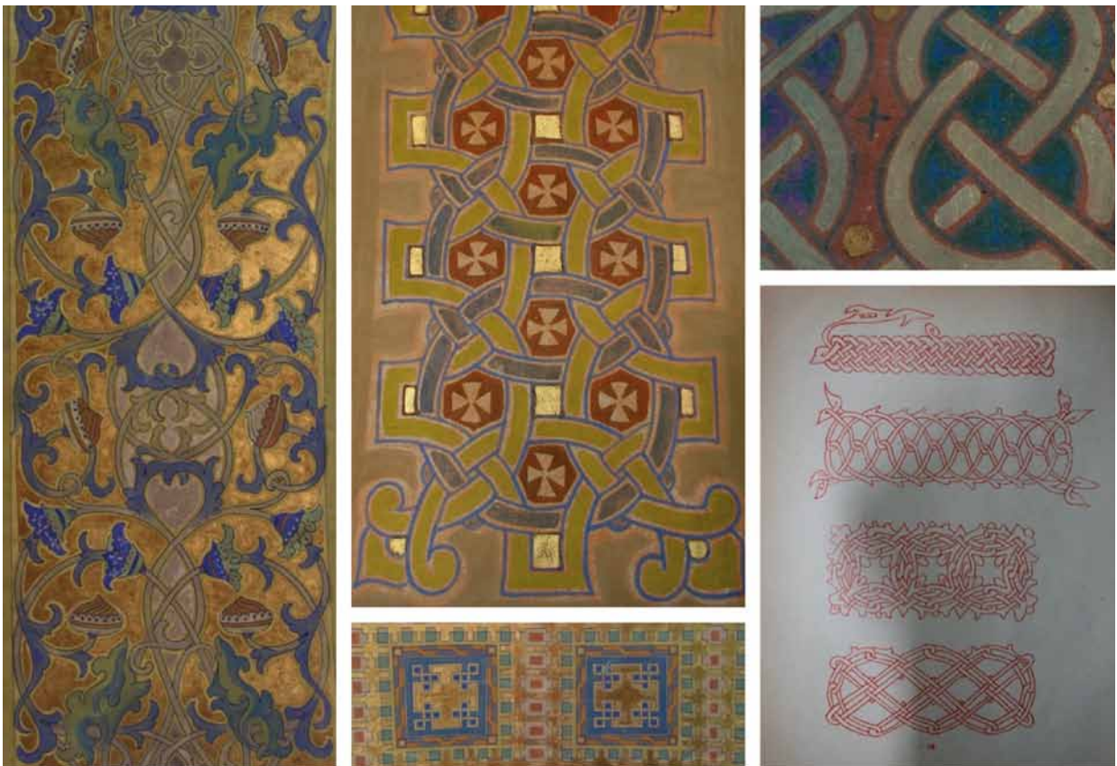
5. Modest Sosenko, Ornamenty , cerkiew Archanioła Michała we wsi Podbereżce oraz Rysunki M. Sosenki, odwzorowane z ukraińskich rękopisów XVI w., za: Prykrasy galickih rukopisiv XVI i XVII vv. zrisovani Modestom Sosenkom (+ 1920). (Iz zbirk Nacional'noho Muzeu u Lvovi), Lwów, 1923, tabl. X