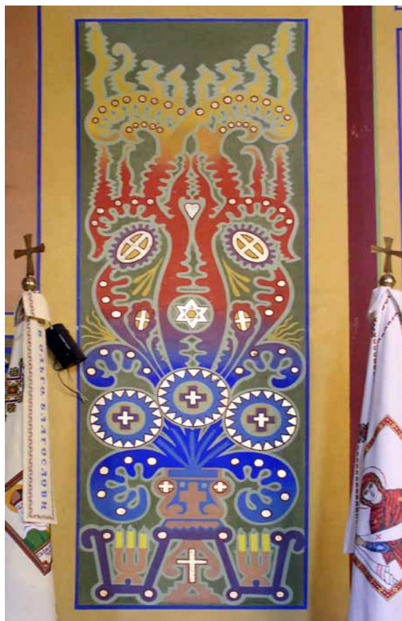
14. Modest Sosenko, Drzewo Życia z symboliką Serca Chrystusowego w malarstwie ściennym , 1912–1913, polichromia w cerkwi św. Mikołaja w Złoczowie

Nawet tych kilka przykładów dorobku Modesta Sosenki służyć może za podstawę do obserwacji procesu kształtowania się manieri artysty. W świątyni w Podbrzeźcach zauważalne jest jeszcze jego zakłopotanie, przejawiające się w angażowaniu różnych źródeł i próbie ich połączenia w całość ideową oraz stylistyczną po przepuszczeniu przez własne uczucia estetyczne. W późniejszych realizacjach widzimy przejaw większej swobody, brak ograniczenia pierwowzorami, operowanie już opracowanym i zaaprobowanym ogólnym systemem fresków, korygowanie proporcji ich podstawy konstrukcyjnej, mniej więcej ukształtowany zestaw motywów ornamentalnych, uwzględnienie specyfiki architektury. W ostatniej pracy artysta prawie całkowicie zrezygnował z obrazów figuratywnych, wprowadził do systemu fresków nową stylizowaną ornamentykę roślinną. Łącząc ją ze starszymi wzorcami,