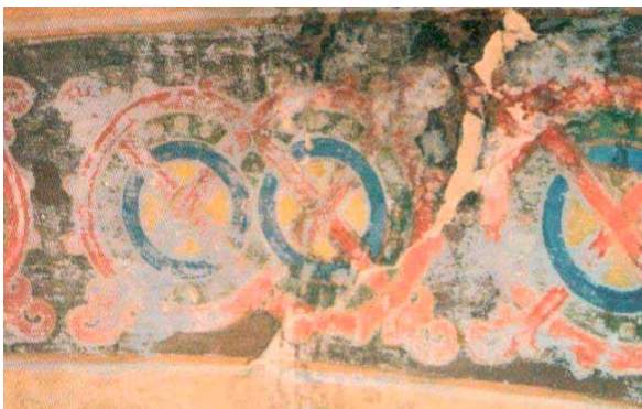
11. Polichromia M. Sosenki przed renowacją, cerkiew św. Mikołaja w Złoczowie, za: T. Otkowič, Restavraciâ nastinnih rozpisiv Modesta Sosenka v cerkvi Sv. Mikolaja v Zoločevi , w: Bûleten' 2008, nr 10, il. w dodatku między s. 134–135.

11. M. Sosenko's Polychrome before the Renovation, the Church of St Nicholas in Zolochiv, after T. Otkovych, Restavratsiia nastinnykh rozpisiv Modesta Sosenka v tserkvi Sv. Mykolaia v Zoločeni , in: „Biuletен' L'vivs'koho filialu Natsional'noho naukovodoslidnoho restavratsiinoho tsentru Ukraïny”, 2008, no. 10, ill. in the appendix between pp. 134–135.