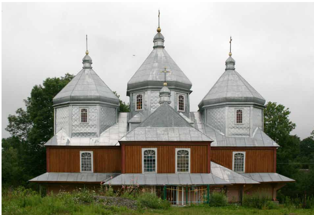
7. Cerkiew św. Zmartwychwstania we wsi Polany, 1903