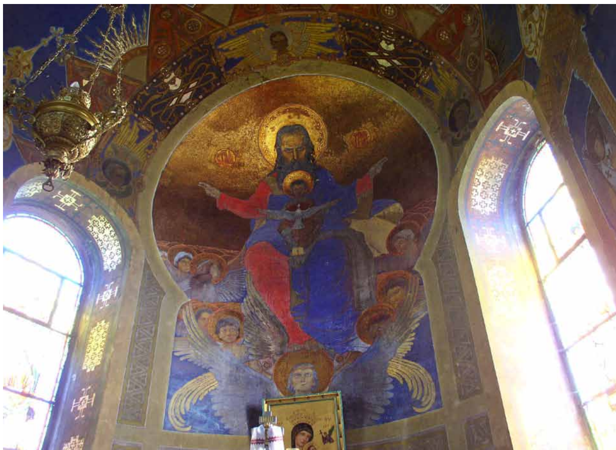
2. Modest Sosenko, Nowotestamentowa Trójca Święta w prezbiterium , 1908–1910, cerkiew Archaniola Michała we wsi Podberże