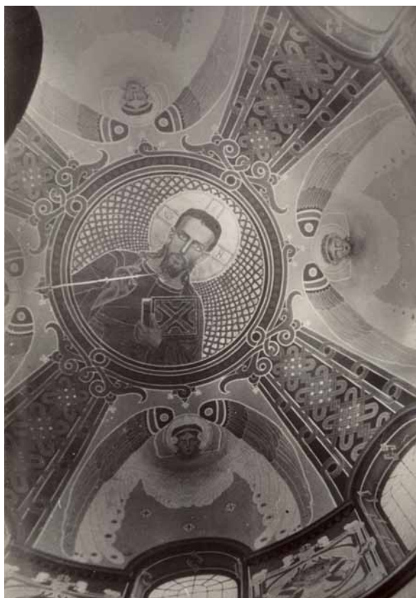
8. Modest Sosenko, kopuła, cerkiew Zaśnięcia Najświętszej Maryi Panny w miejscowości Sławsko, zdjęcie z lat 1910–1920 (?)