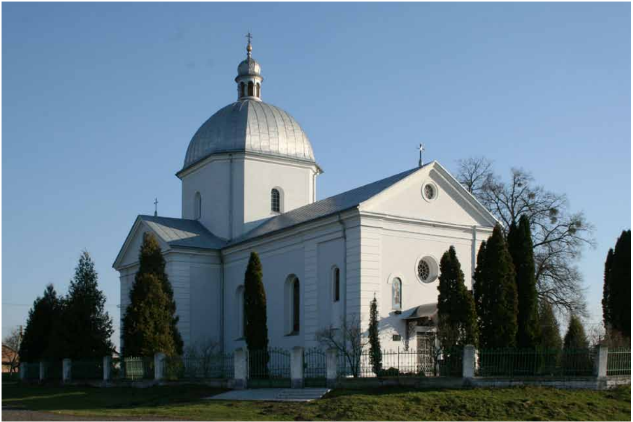
1. Architektoniczne biuro Iwana Lewińskiego, cerkiew Archanioła Michała we wsi Podberieżce, lata 90. XIX wieku