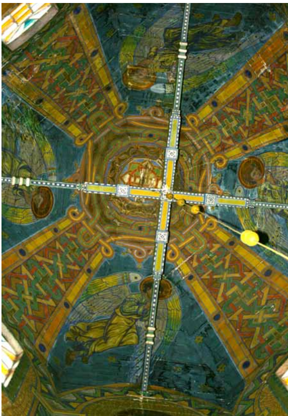
9. Modest Sosenko, Sklepienie centralnej kopuły, 1911–1912, cerkiew św. Zmartwychwstania we wsi Polany