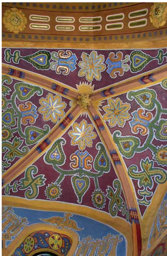
13. Modest Sosenko, sklepienie, 1912–1913, polichromia w cerkwi św. Mikołaja w Złoczowie, fot. O. Semchyszyn-Huzner

13. Modest Sosenko, vault, 1912–1913, polychrome in the Church of St Nicholas in Zolochiv, phot. O. Semchyszyn-Huzner