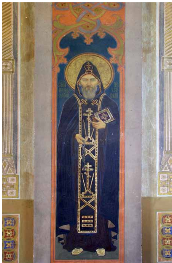
6. Modest Sosenko, św. Teodozjusz , cerkiew Archanioła Michała we wsi Podbereżce, fot. O. Semchyszyn-Huzner