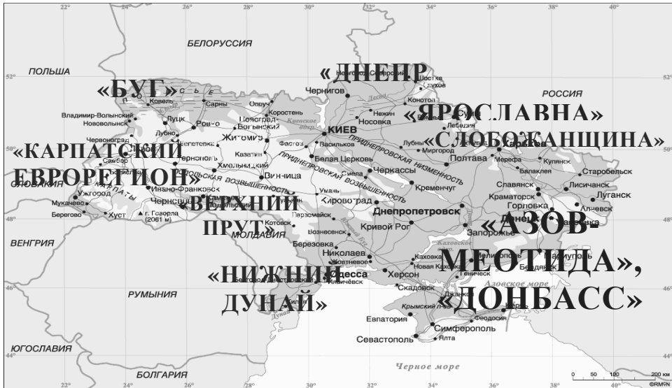
Рисунок 2. Еврорегионы в Украине

региональных властей и органов местного самоуправления заинтересованных в этом сотрудничестве государств.