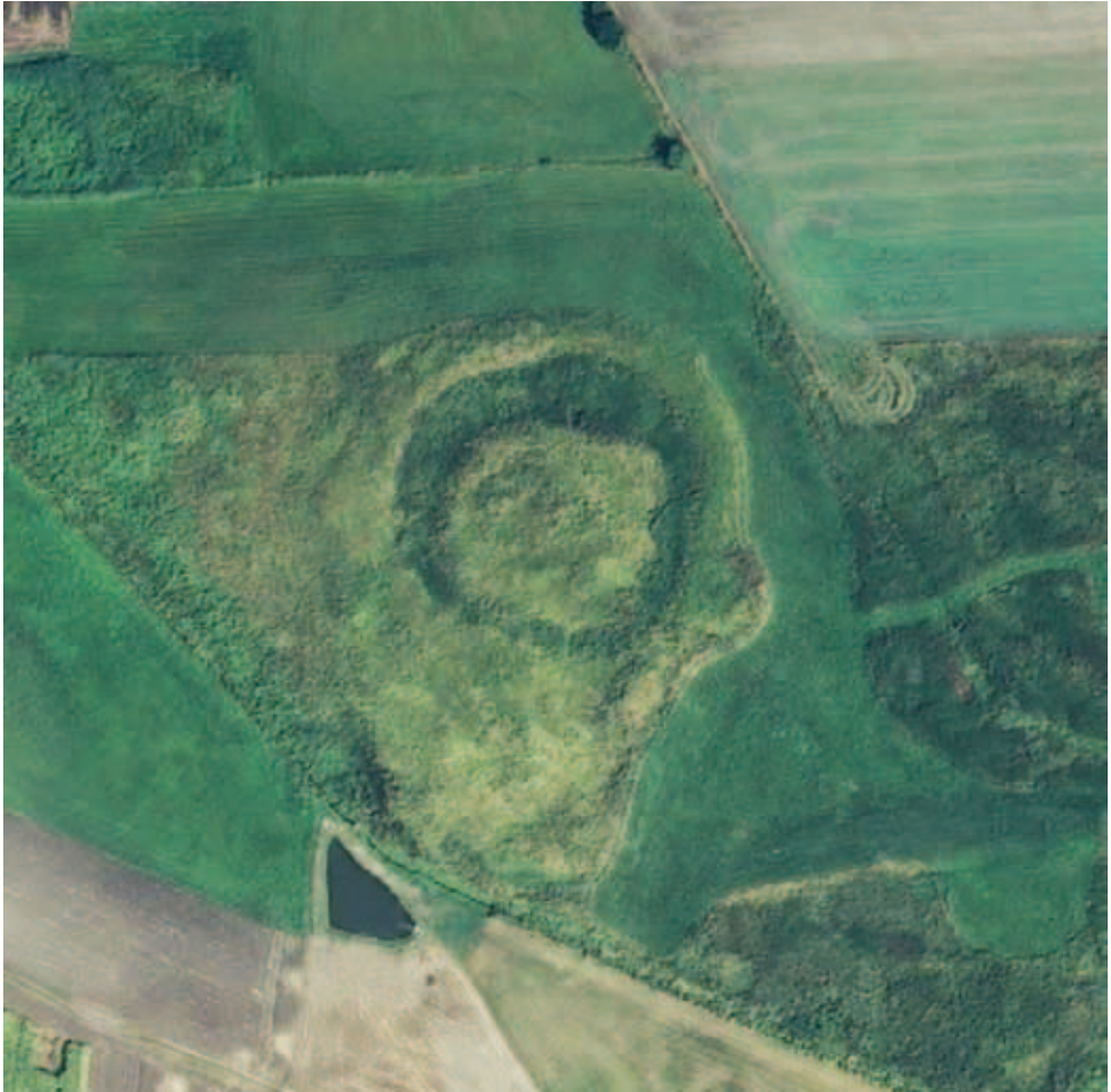
Fig. 1. Satellite photo of motte castle at Zawalów Kolonia. Plainly visible is the three-piece configuration of earthwork remains, that is: mound, bailey and circular rampart.

Ryc. 1. Zdjęcie satelitarne grodziska w Zawalowie Kolonii. Wyraźnie widoczny jest trójczłonowy układ reliktu ziemnego, składający się z kopca, tzw. przygródka i wału okrężnego.