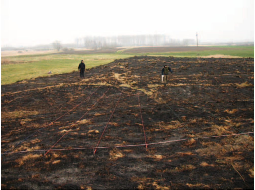
Fig. 3. Geophysical prospection by geomagnetic method. Geoscan Research fluxgate gradientometer FM 256. View of the bailey from the southern side.

Ryc. 3. Badania geofizyczne metodą magnetyczną. Gradientometr fluxgate Geoscan Research FM 256. Widok na przygródek od strony północnej.