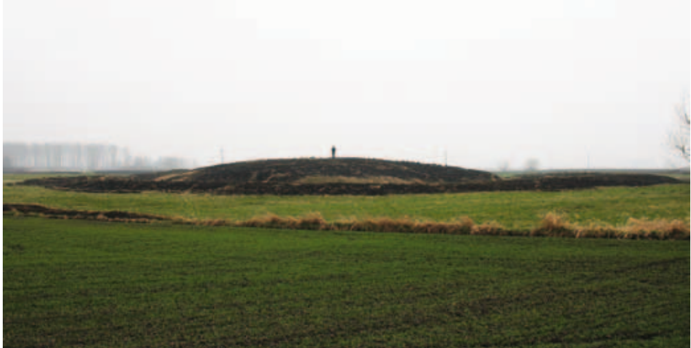
Fig. 2. Motte castle at Zawalów Kolonia, Miączyn commune. View of the rampart and mound from the northern side.

Ryc. 2. Grodzisko stożkowate w Zawalowie Kolonii, gm. Miączyn. Widok na wał i kopiec od strony północnej.