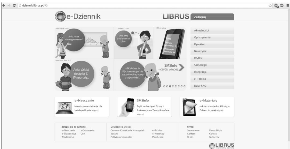
Rys. 1. Dziennik elektroniczny Librus

Ponadto, jako kanał informacyjny oraz komunikacyjny stosowany jest dziennik elektroniczny Librus .