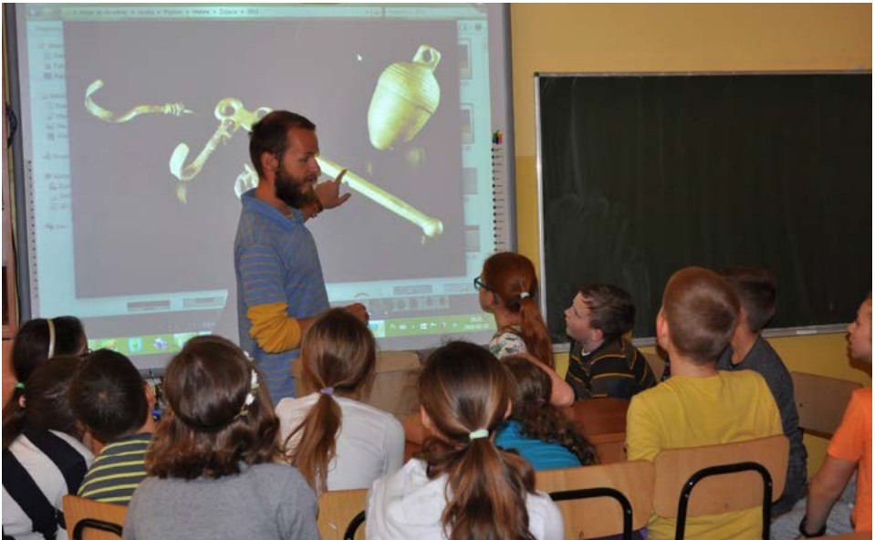
Fot. 2. Zajęcia z uczniami Szkoły Podstawowej Sióstr Salezjanek w Krakowie