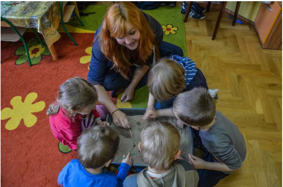
Fot. 3. Zajęcia z wychowankami Przedszkola nr 7 Sióstr Serafitek w Krakowie