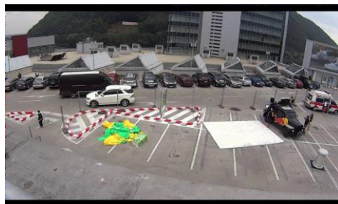
Obr. 2 Outbreak – voľný priestor s pokračovaním do zastrešeného objektu