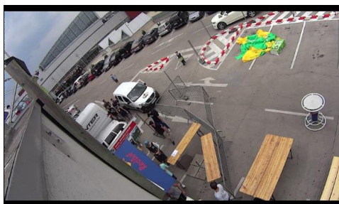
Obr. 1. Outbreak – vstup do priestorov podujatia

Festival bežne prebieha na troch priestranstvách, z ktorýchjedno je mimo dosahu zastrešenia druhého podlažia strešného parkoviska: obr. 1 – vstup na podujatie, obr. 2 – voľný priestor s pokračovaním do zastrešeného objektu, obr. 3 – hlavné vonkajšie pódium. Fotografie na obr. 1–3 dokumentujú stav vonkajších priestorov podujatia po prudkej búrke sprevádzanej silným dažďom, t.j. ide o dokumentáciu dôsledkov búrky, ktorá postihla minulý ročník festivalu (situácia z roku 2015). Zastrešené priestory podujatia sú dokumentované na obr. 4. Vybavenie týchto priestorov pozostáva v prevažnej časti z reproduktorov, ozvučovacích zariadení a svetiel, prípadne ďalších zariadení, ktoré si účinkujúci priniesú zo sebou. Nachádza sa tu aj stánok s občerstvením.