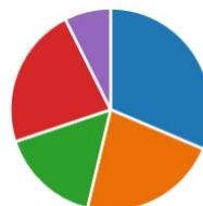
Wykres obrazujący odpowiedzi uczniów na pytanie 3.

Uczniowie mieli świadomość, że nie korzystają w pełni z możliwości, jakie oferuje nauka zdalna. Natomiast dobrze wpływało na ich koncentrację wywolywanie ucznia po imieniu , a także grupowa praca w wirtualnych pokojach . Ponad 100 uczniów wskazało, że lepiej koncentrowali się na zadaniach trwających krótko . Okazuje się, że brakowało uczniom pracy z książką i ćwiczeniami w wersji papierowej , a rozwiązywanie zadań po przeczytaniu tekstu było mobilizujące dla jednej czwartej grupy uczniów. Pytania do nagrań mobilizowały niespełną jedną piątą badanych, być może również z powodu zakłóceń technicznych. Niepokoi fakt, że 75% uczniów nie czyta książek, z czego ponad połowa twierdzi, że nie sięga po książkę ze względu na przemęczenie nauką zdalną.