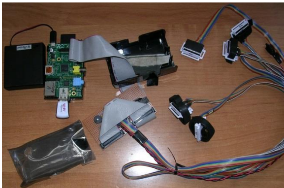
Rysunek 1. Prototyp zestawu pomiarowego – minikomputer Raspberry PI z podłączonymi pięcioma czujnikami inercyjnymi

Po akceptacji protokołu pomiarowego przez prowadzącego studenci otrzymują prototyp zestawu pomiarowego (rys. 1) wraz z dokumentacją najważniejszych elementów i sposobu jego obsługi. Czujniki umieszczone są na kostkach, kolcach biodrowych oraz plecach za pomocą pasków wyposażonych w rzepy. Jednostka centralna znajduje się w saszetce, którą student nosi w pasie.