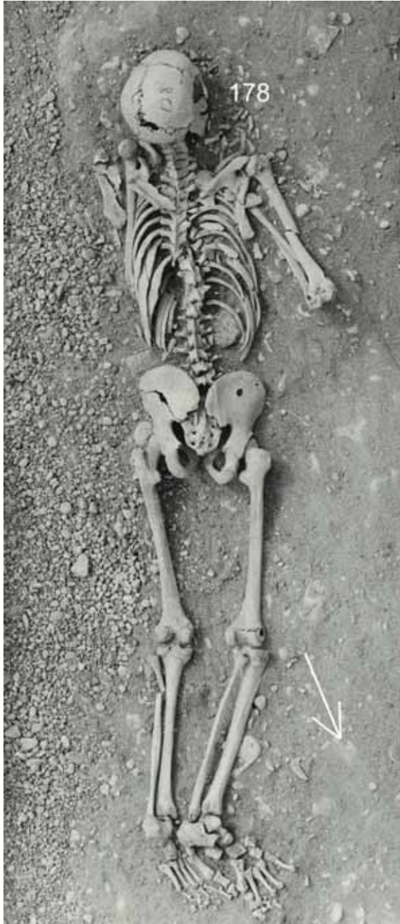
Fig. 2. Prone burial of an adult male (grave 178). Documentation of the excavation by Mälärstedt 1964–1966