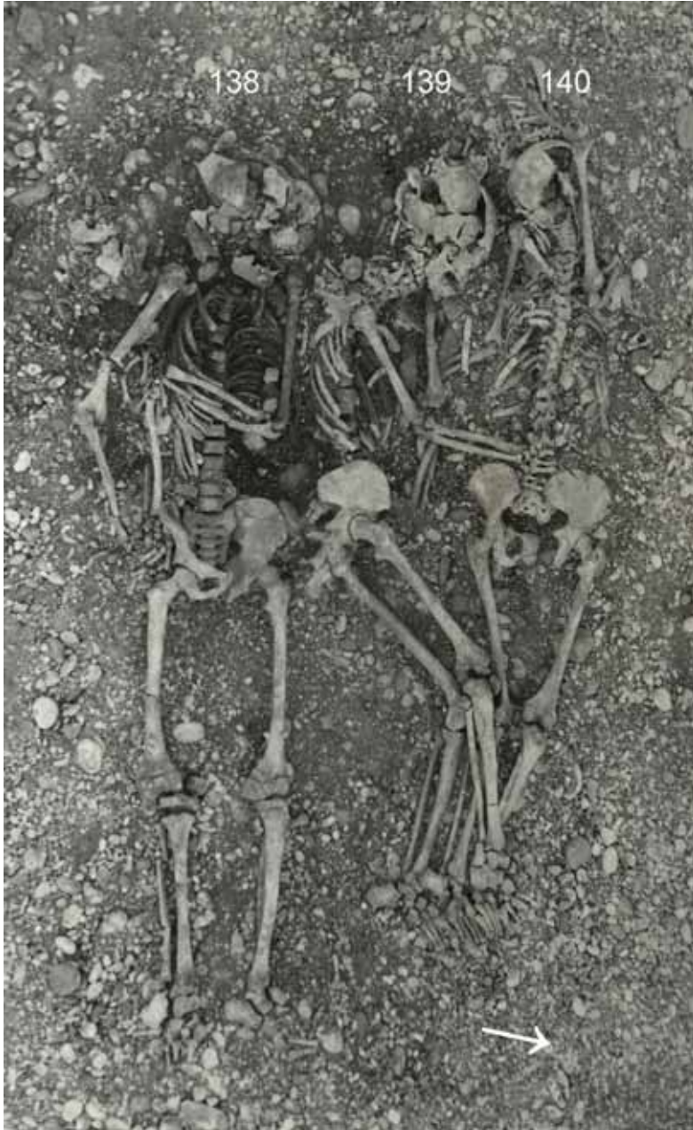
Fig. 5. Triple burial of two males in supine and crouched position and a female in prone position (left side, grave 140). Documentation of the excavation by Mälarstedt 1964–1966

Ryc. 5. Potrójny pochówek dwóch mężczyzn w pozycji na wznak i w pozycji skurzonej oraz pochówek kobiety w pozycji na brzuchu (po lewej, grób 140). Dokumentacja polowa autorstwa Mälarstedt 1964–1966