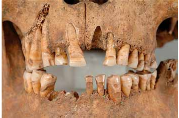
Fig. 3. Skull with filed teeth.

Ryc. 3. Czaszka ze spiłowanymi zębami.