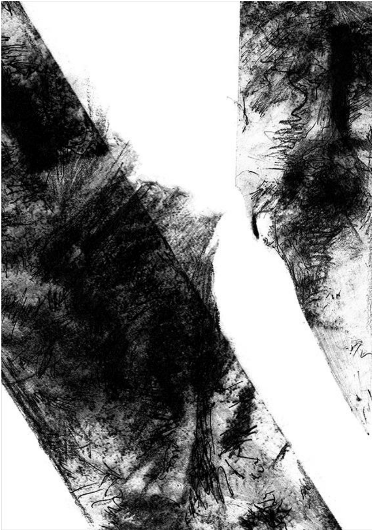
Aneta Suslennikow, Disturb , 2019, 100 x 70, druk pigmentowy