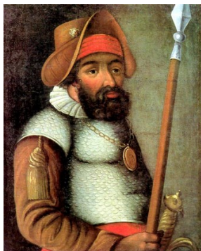
Портрет Ермака Тимофеевича (1– треть XVII в.), автор неизвестен. Портрет хранится в Ставропольском краевом музее изобразительных искусств

Они отдавали дань революционно-романтическому мифу о будущем, но при этом видели и подчеркивали, что в новую действительность вступают не совершенные, идеальные герои (каких выискивала и в жизни, и в литературе рапповская и подобная ей идеологизированная критика), а реальные люди со всеми их противоречиями, с «ветхим Адамом традиционных привычек, настроений, вкусов» (Воздвиженский 2001: 35).