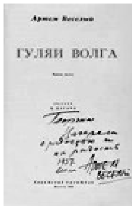
Весельный А. [автограф] Гуляй Волга / рис. Д. Дарана, 6-е изд.

году роман был завершен, хотя сам автор признавался, что работу можно было бы продолжить, настолько много материала еще оставалось неизученным.