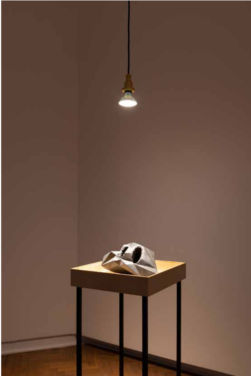
Magdalena Franczak, "Stone gloves", 39x40x18, stone sculpture (granite)