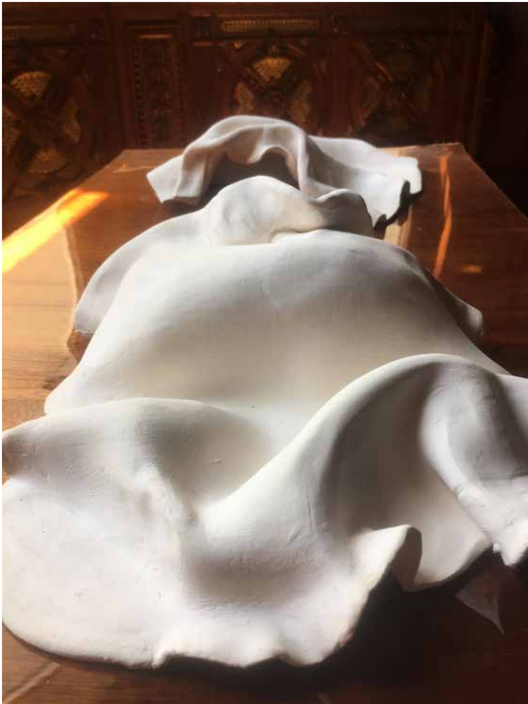
Magdalena Franczak, 2022 "Schrony dla niewypowiedzianych słów" (Shelters for unspoken words), 5 wooden pieces 38x52, 44,5 x 80, 38x57,5, 40x78, 32x76, 5 ceramic sculptures 20x30x4.