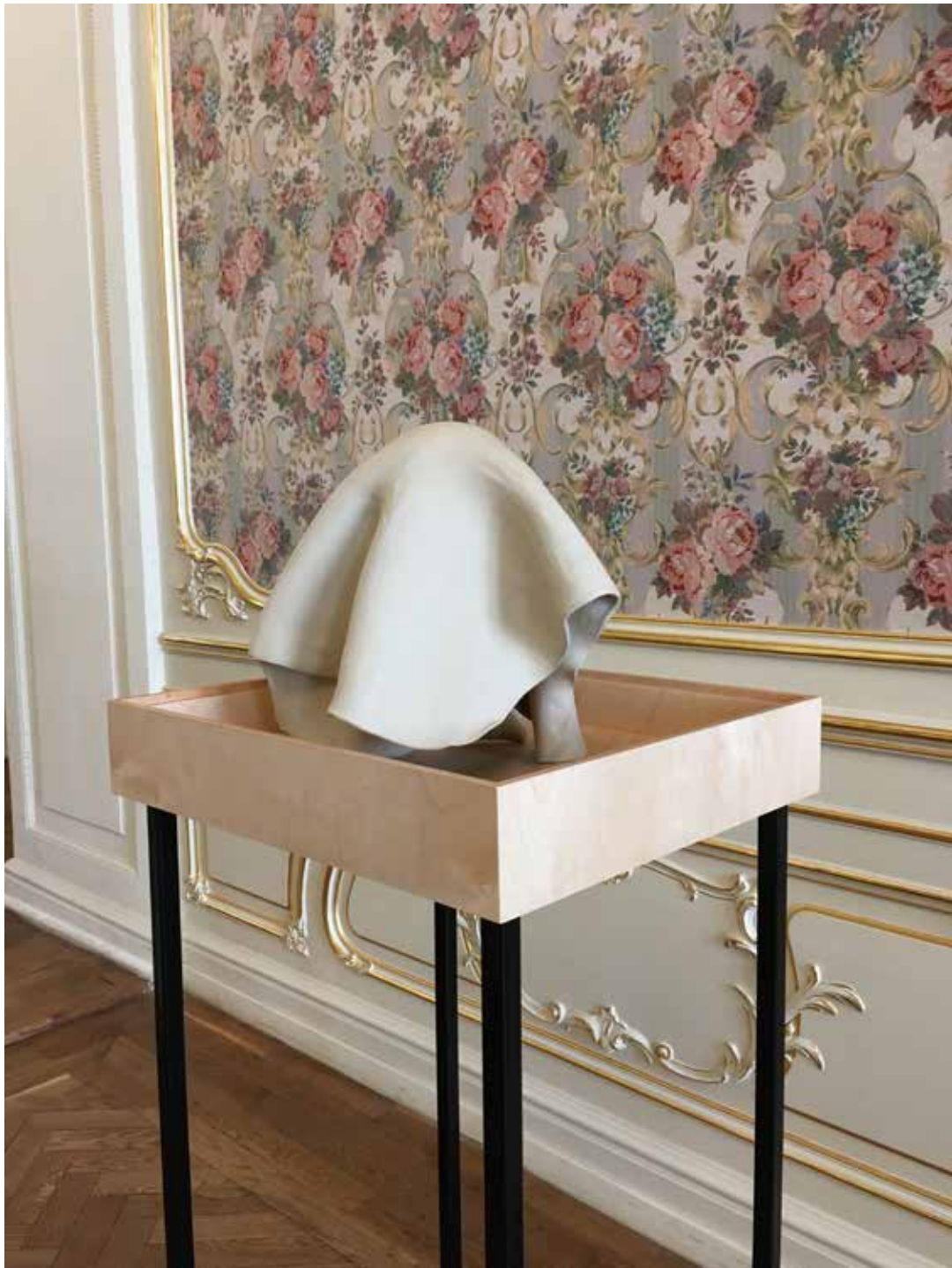
Magdalena Franczak, "Siostra"/Sister, 25x30x26, ceramic sculpture