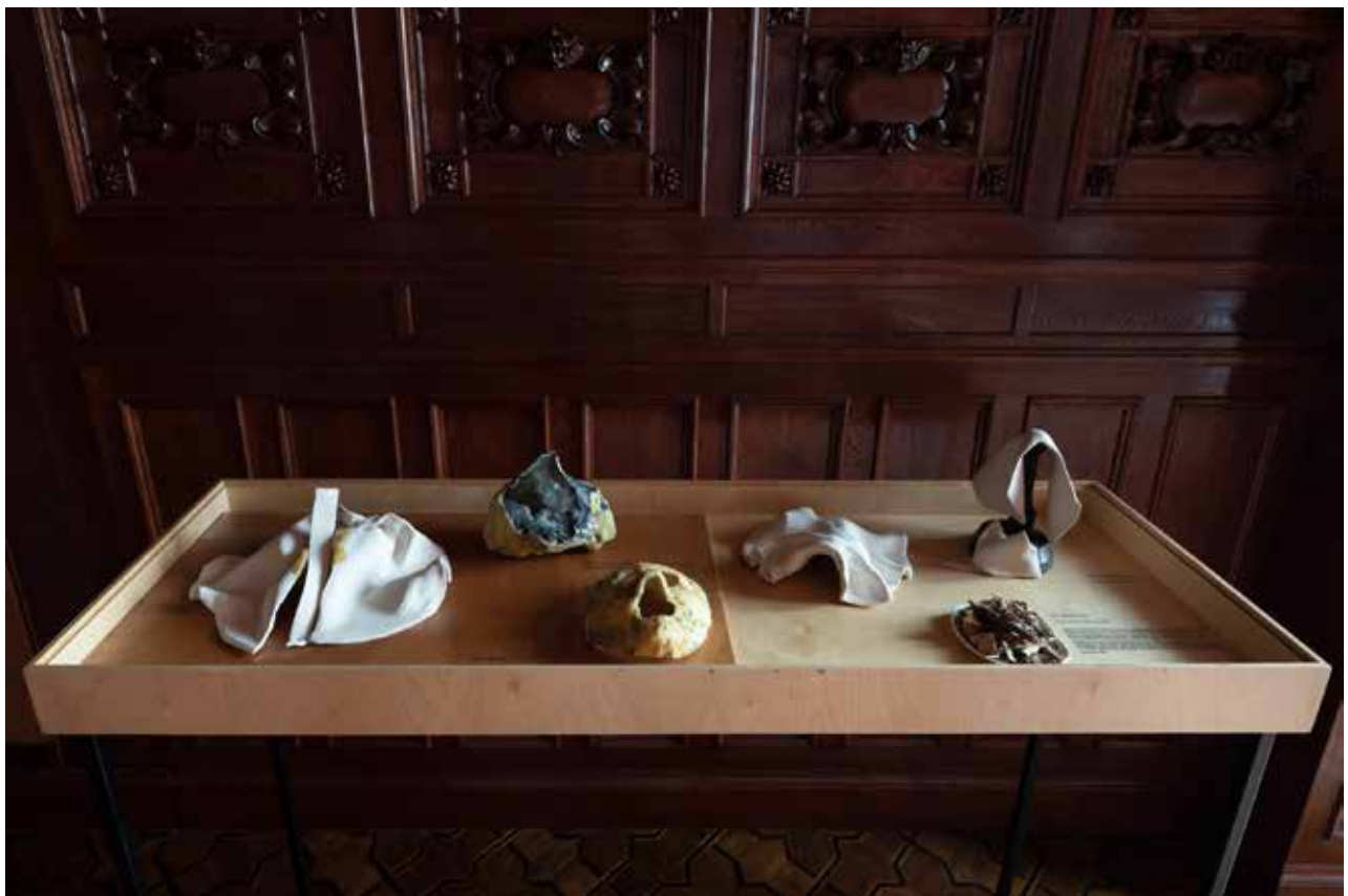
Magdalena Franczak, "Mała siostra" (Little sister), 20x10x16, ceramic and wood