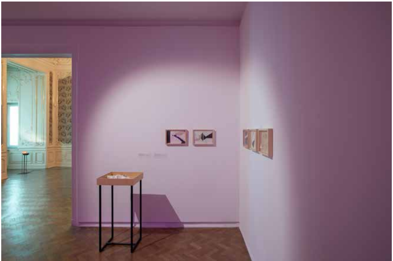
Magdalena Franczak, "Schrony dla niewypowiedzianych słów"(Shelters for unspoken words), 5 drawings on acid-free paper, framed. 29,5x21.