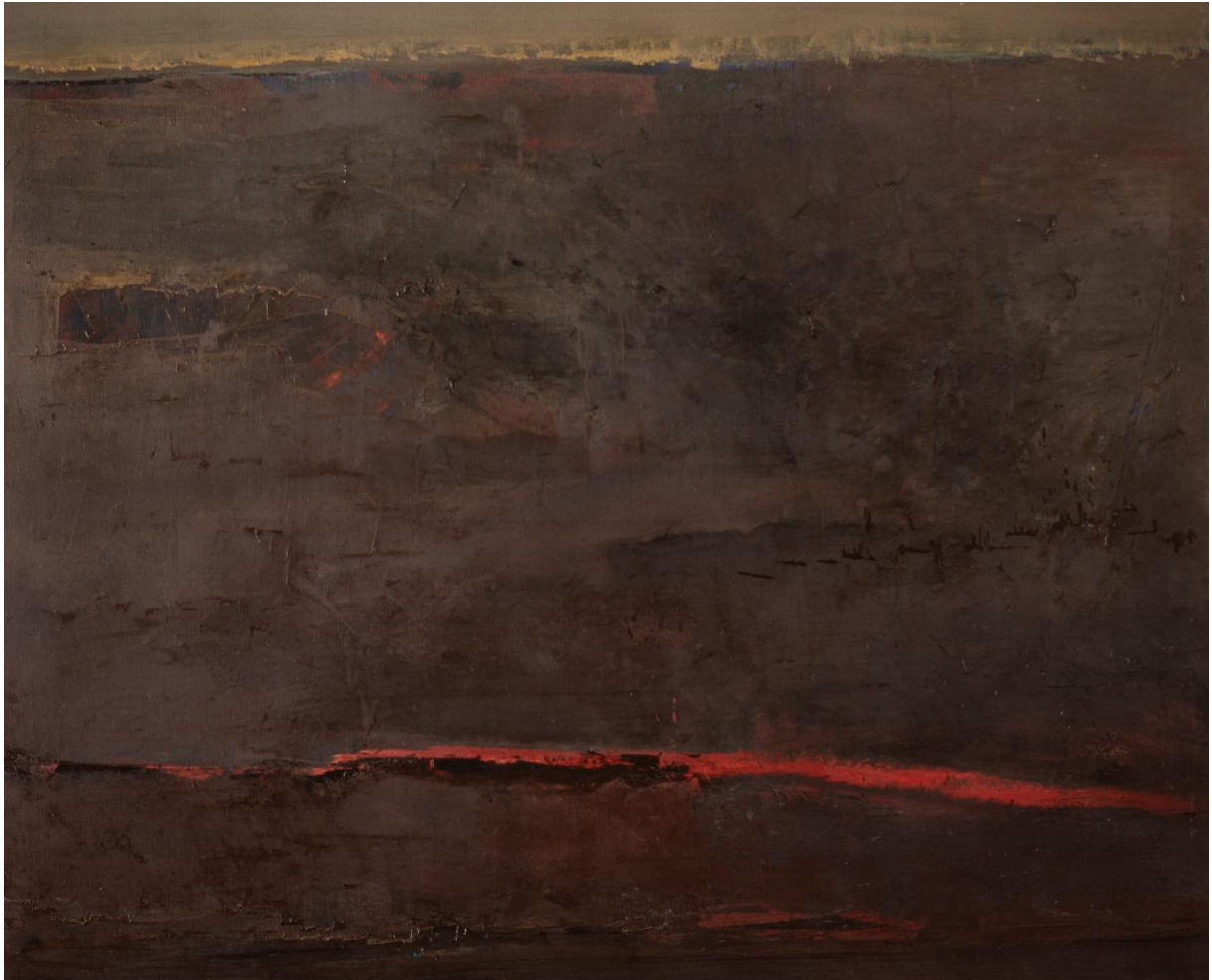
Łukasz Gil/Fragmenty obecności 2016/ Obraz w kolekcji BWA Rzeszów