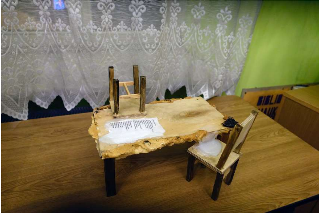
Rzeźba Eweliny Figarskiej w bibliotece Towarzystwa Przyjaciół Nauk w Przemyślu, fot. J.Sawicka.