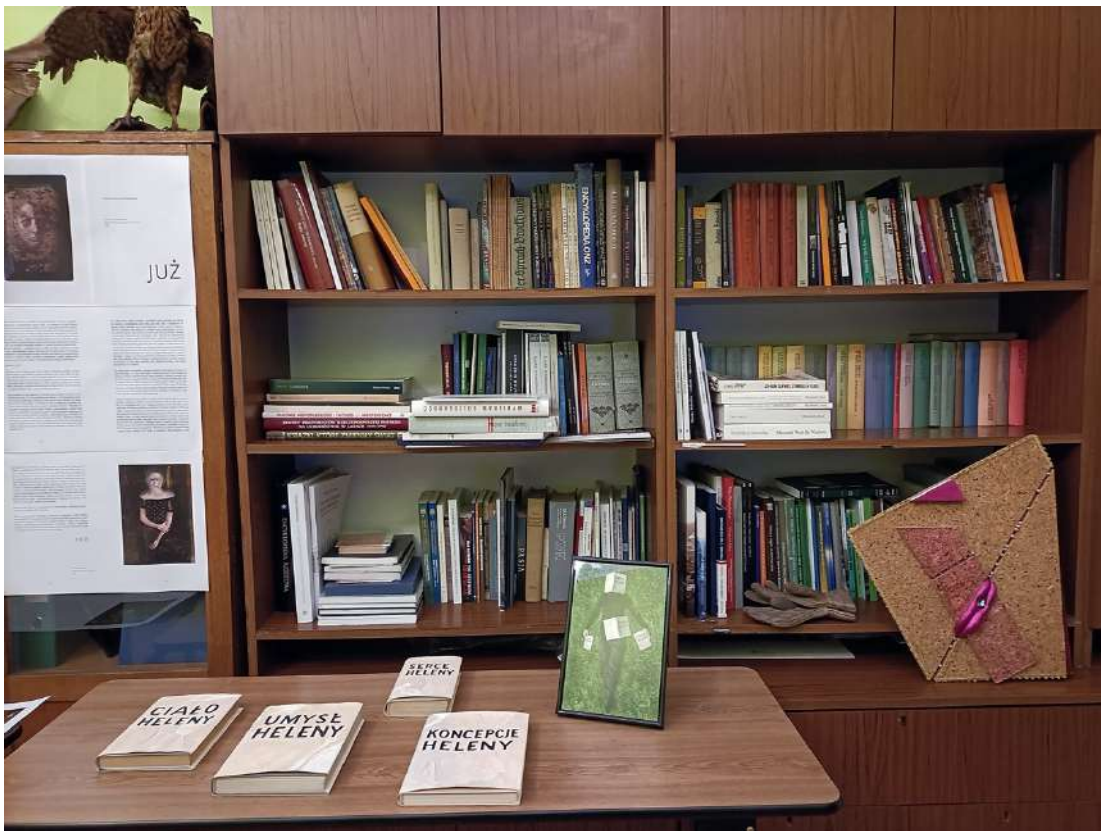
Instalacja Jadwigi Sawickiej w bibliotece Towarzystwa Przyjaciół Nauk w Przemyślu, fot. J.Sawicka.