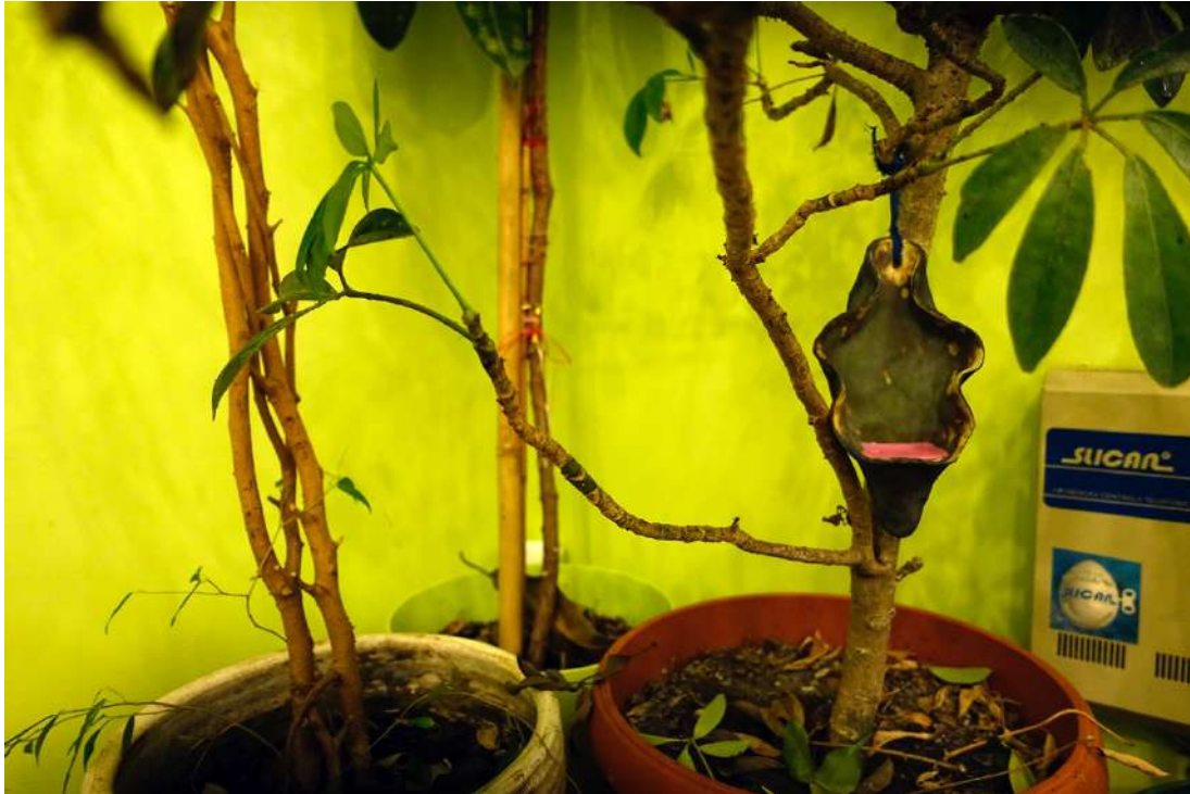
Instalacja Magdaleny Franczak w bibliotece Towarzystwa Przyjaciół Nauk w Przemyślu, fot. J.Sawicka.