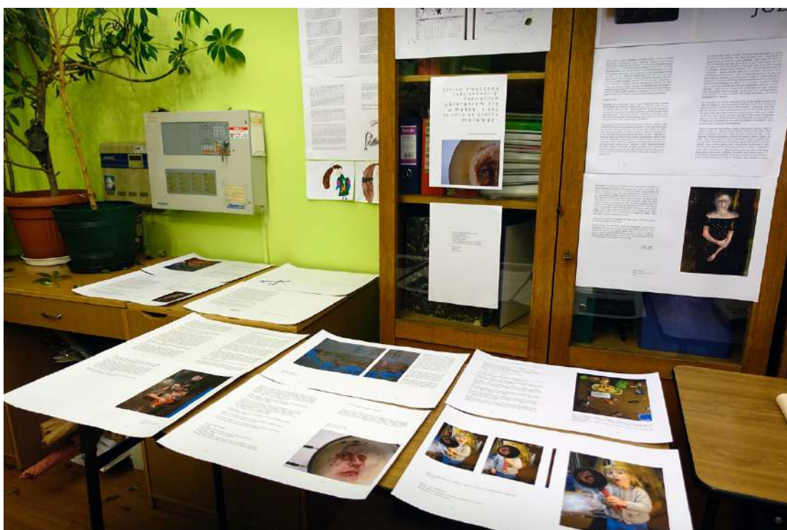
Strony z książki Mamalarka Barbary Porczyńskiej w bibliotece Towarzystwa Przyjaciół Nauk w Przemyślu, fot. J.Sawicka.