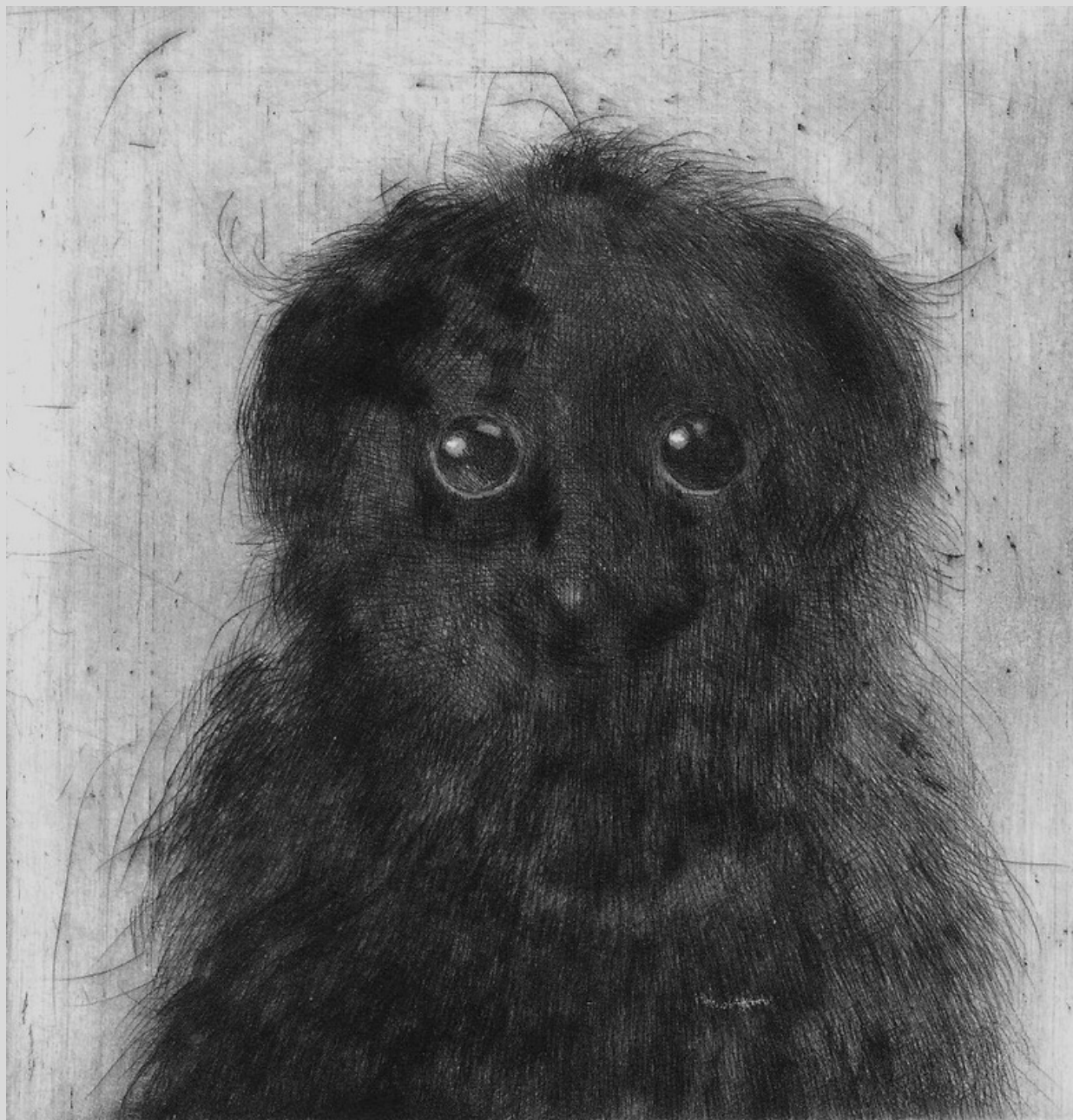
Czarny , sucha igła, 10cm x 10 cm, 2016