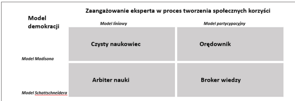
Rys. 1. Role społeczne uczonych