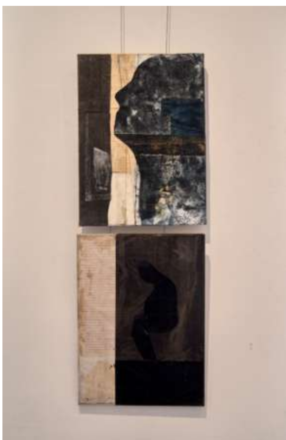
Fragment ekspozycji pt. ANTABA 2024, Galeria ECK LOGOS, Łódź (strona organizatora)

https://www.ur.edu.pl/index.php/pl/wydzialy/wydzial-sztuk-pieknych/wydzial/aktualnosc/zapraszamy-na-przekrojowa-wystawe-malarstwa-pt-antaba-2024-prof-ur-malgorzaty-drozd-witek-w-europejskim-centrum-kultury-logos-w-lodzi