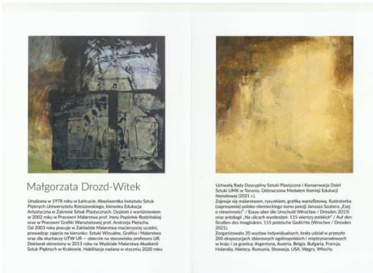
Folder wystawy, str. 2, 3