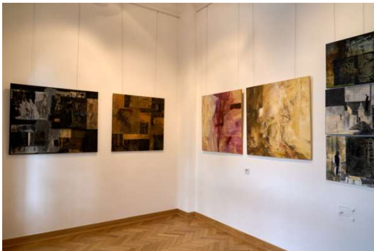
Fragment ekspozycji pt. ANTABA 2024, Galeria ECK LOGOS, Łódź (strona organizatora)