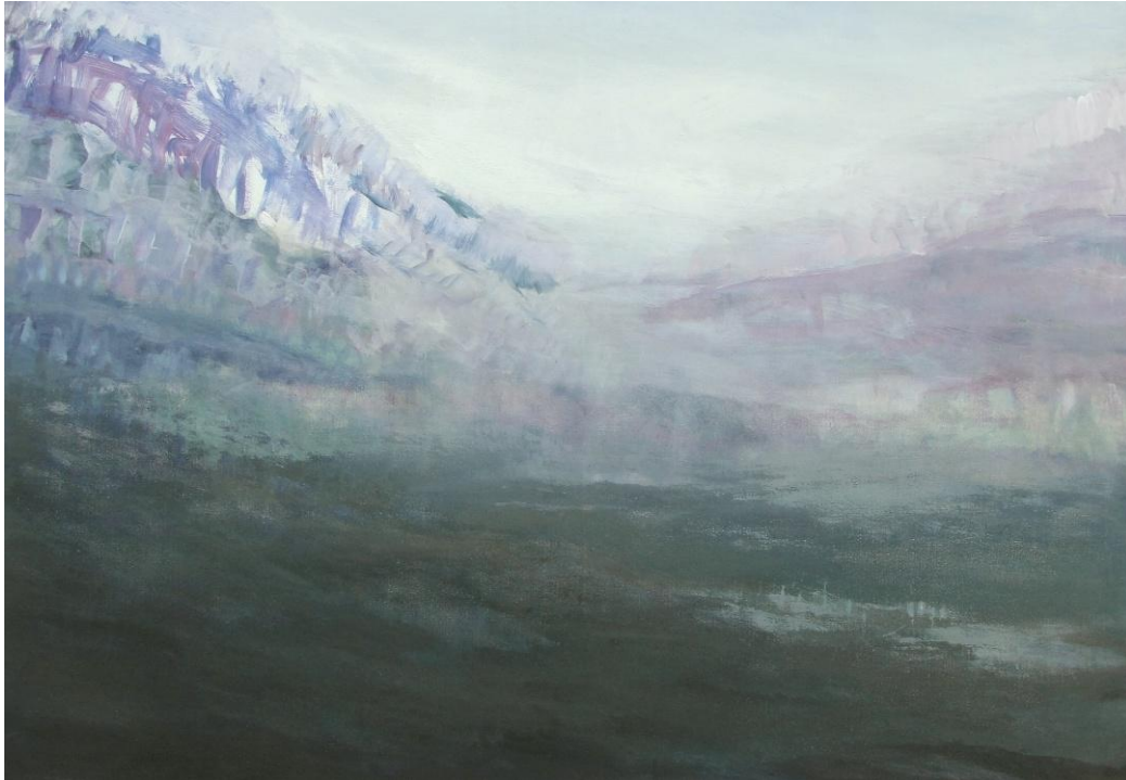
Dzień drugi akryl na płótnie, 2020, 90x130 cm