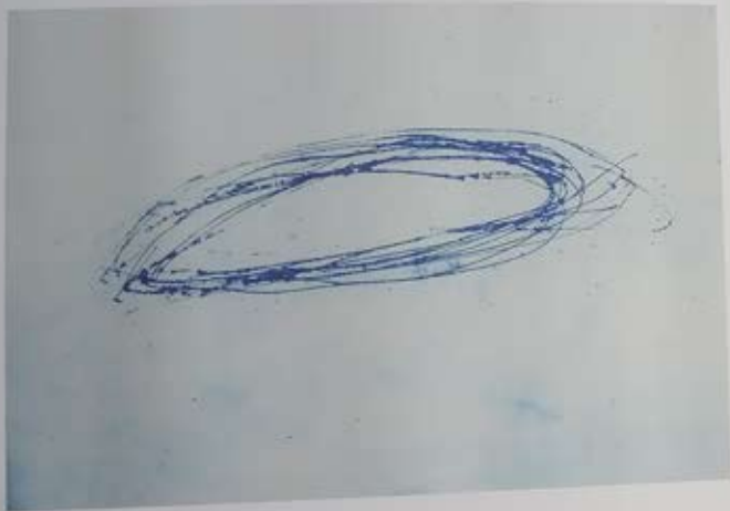
Chłód III , 2025, intaglio, 70 x 100 cm

Mamy zaszczyt zaprosić 24 listopada 2023 (piątek) o godz. 18.00 na otwarcie wystawy grafiki