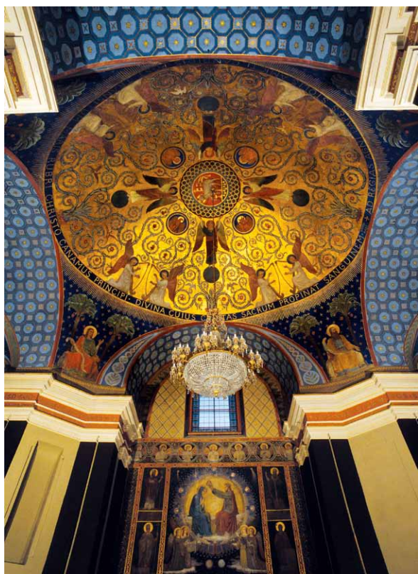
7. Beuroňská Škola Sztuki Sakralnej, malarstwo ścienne, 1887–1888, Hradec Králové, dawny kościół seminaryjny pw. św. Jana Nepomucena (część środkowa), fot. O. Nepilý