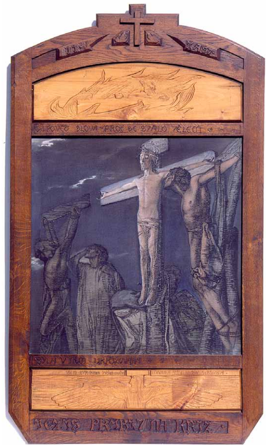
11. František Bílek, Droga Krzyżowa , stacja XI – Jezus przybity do krzyża , 1905–1906, tempera na płótnie i płaskorzeźby w drewnie, Prostějov, kościół parafialny pw. Podwyższenia Krzyża Świętego

10. Viktor Foerster, Stations of the Cross , 6 th Station – Veronica gives the Lord her Veil , 1906, oil on a panel and carved wooden frame, Němčice na Hané, Parish Church of St Mary Magdalene