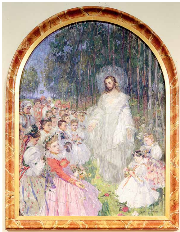
2. Zdenka Vorlová-Vlčková, Najświętsze Serce Jezusowe (Chrystus – przyjaciel dzieci) , 1910, olej na płótnie, Ostrawa-Mariánské Hory, kościół parafialny pw. Ukoronowania Najświętszej Maryi Panny, fot. L. Teplý