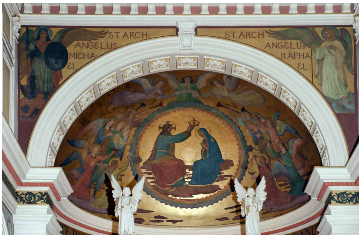
8. Martin Matouš i Beurońska Szkoła Sztuki Sakralnej, Koronacja Maryi Panny i Świętych Archaniołów Michała i Rafała , ok. 1905 r., malarstwo ścienne, Opawa, klasztor Sióstr Miłosierdzia, kościół Matki Bożej z Lourdes