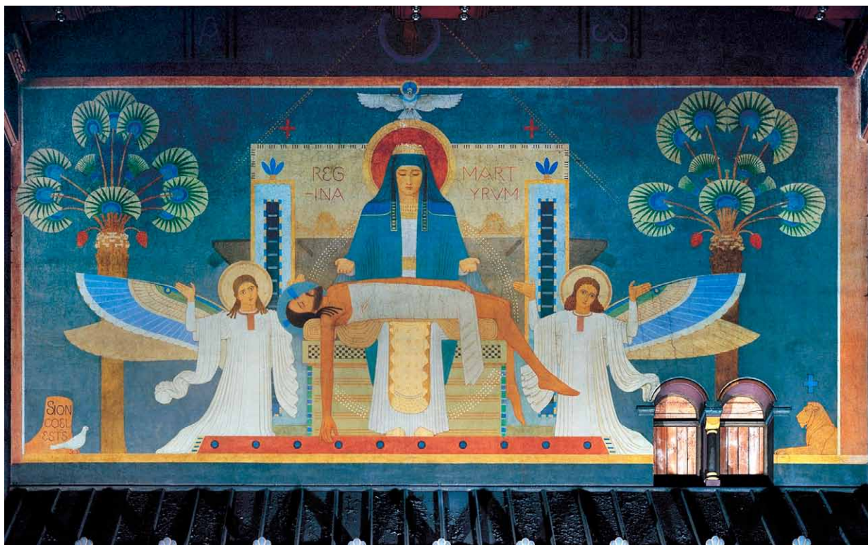
5. Dezyderiusz Piotr Lenz i Beurońska Szkoła Sztuki Sakralnej, Pieta (Regina martyrum) , 1895–1896, fresk, Praga-Smíchov, dawny klasztor benedyktynów, kościół Zwiastowania Najświętszej Maryi Panny (św. Gabriela)