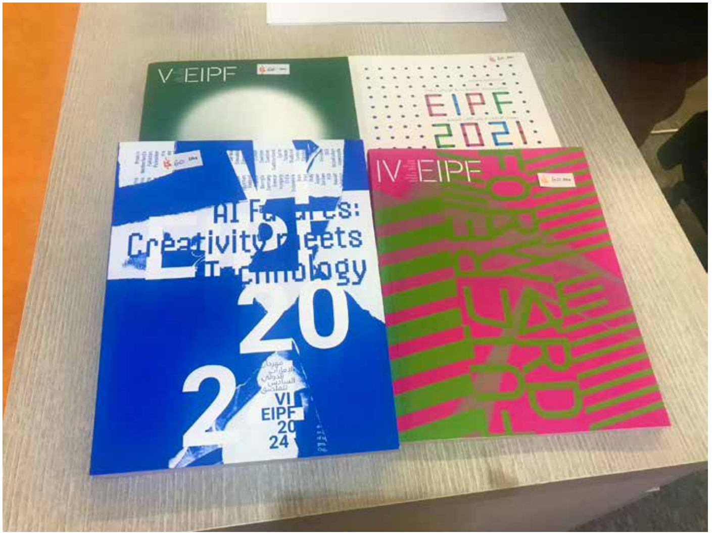
'AI Futures: Creativity Meets Technology', 2024, katalog wystawy