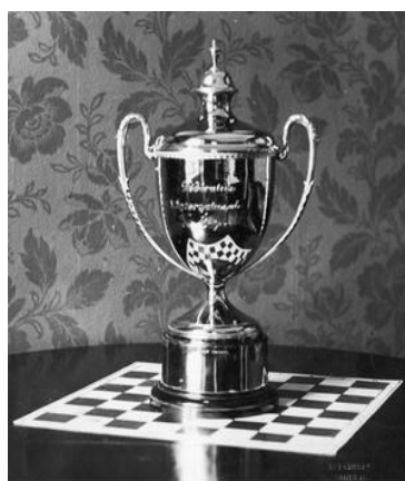
Fot. 11. Puchar Hamiltona-Russela na olimpiadzie szachowej