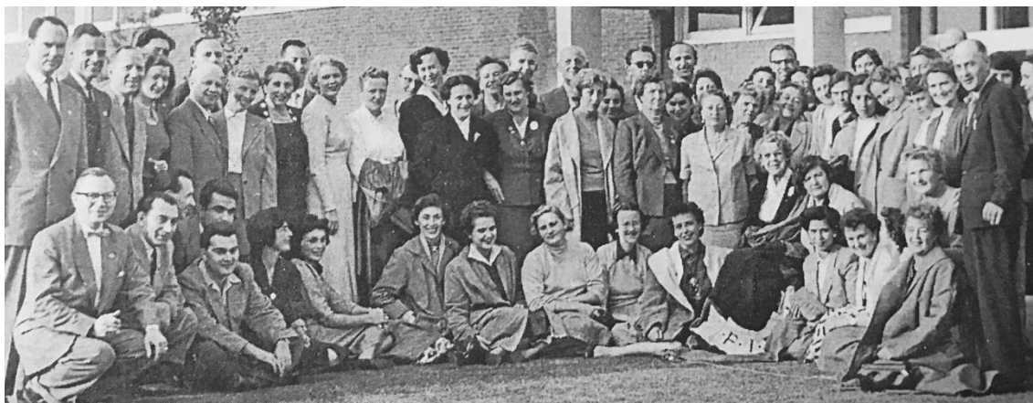
Fot. 19. Uczestniczki, sekundanci, organizatorzy I Olimpiady Szachowej kobiet w Emmen w 1957 roku