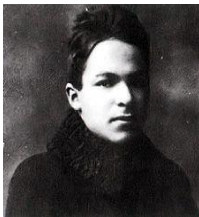
Fot. 7. Izaak Towbin