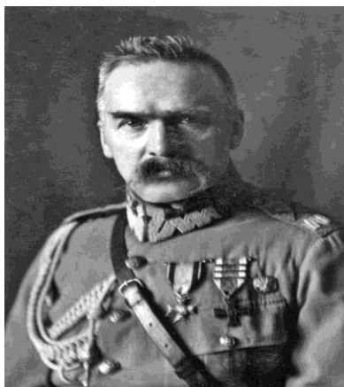
Fot. 10. Józef Piłsudski