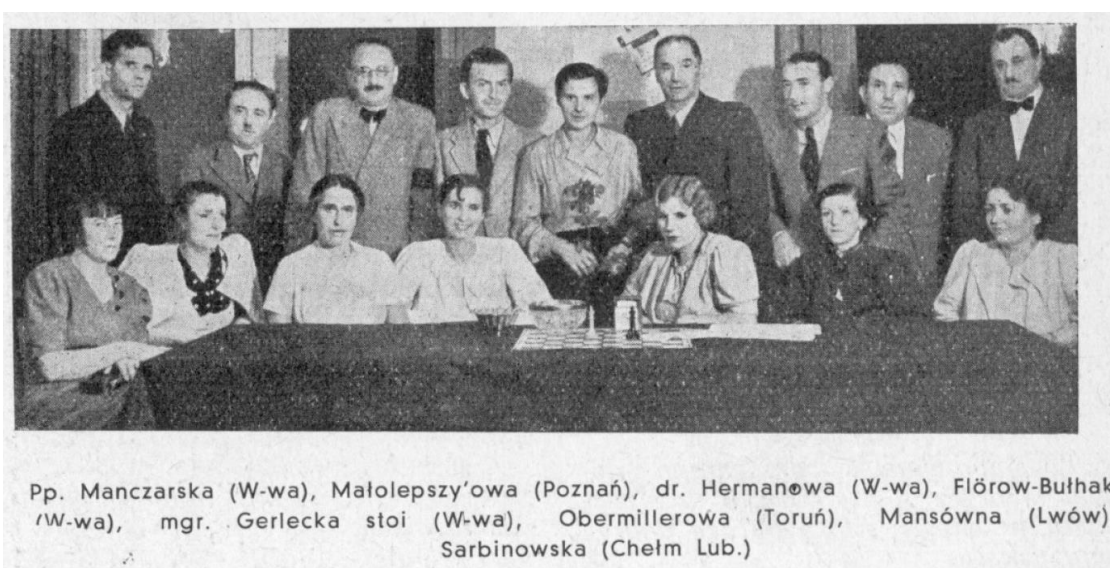
Fot. 15. II Turniej Pań o Mistrzostwo Polski w 1937 roku