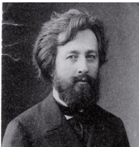
Fot. 2. Ludomir Benedyktowicz

Klub Szachistów 72 (KKSz). Jego prezesem został Ludomir Benedyktowicz 73 , znany poeta i malarz 74 .