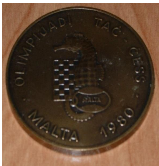
Fot. 39. Brązowy medal z XXIV Olimpiady Szachowej – Valletta (Malta) 1980 rok

Małgorzata Wiese wielokrotnie reprezentowała Polskę w rozgrywkach drużynowych, m.in.: sześciokrotnie na olimpiadach szachowych w latach: 1978, 1980, 1982, 1984, 1986, 1988. Za najważniejszy należy uznać w 1980 roku. Właśnie wtedy polska reprezentacja kobiet zdobyła brązowy medal na olimpiadzie szachowej w Valletcie (Malta) 816 .