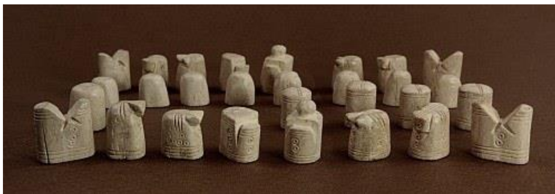
Fot. 1. Szachy sandomierskie

Odkryta przed I wojną światową w Krakowie, w gruzie wywożonym najprawdopodobniej z Wawelu, romańska figurka wojownika, wyrzeźbiona w kości słoniowej, datowana na XII wiek została uznana za bierkę szachową. Pozostawała ona w posiadaniu Muzeum Archeologicznego w Krakowie. Niestety padła łupem hitlerowców w czasie II wojny światowej, przez co możliwość dalszych badań została przekreślona i niemożliwe stało się precyzyjne ustalenie jej pochodzenia oraz dokładnego wieku. Niezwykle cennym odkryciem są tzw. „szachy sandomierskie”, określane także mianem „szachów piastowskich”, a przechowywane w Muzeum Okręgowym w Sandomierzu 57 .