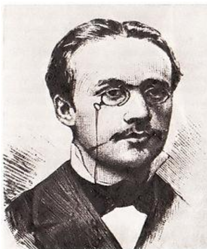
Fot. 8. Józef Żabiński

Prezura Józefa Żabińskiego (1860-1928), absolwenta Wydziału Prawa Uniwersytetu Warszawskiego, była uwieńczeniem jego wszechstronnej działalności w dziedzinie szachów. W okresie 1880-1896 był, obok Sz. Winawera i M. Landaua, jednym z najsilniejszych polskich szachistów 116 .