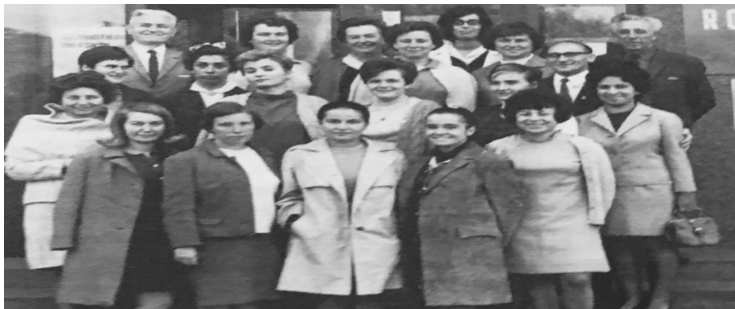
Fot. 14. Uczestniczki, sędziowie i organizatorzy turnieju strefowego w Veselý rozegranego w 1969 roku

Litmanowicz odpierała tego typu zarzuty, stawiane przez Krzysztofa Pytla na łamach „Trybuny Ludu” 386 . Dodatkowo zamieściła szczegółowy opis „dyskryminacji szachistek” w swojej książce zatytułowanej Moja przygoda z szachami , gdzie przywołuje w niej osobiste doświadczenia z turniejów szachowych, w których występowała wraz z K. Hołuj-Radzikowską.