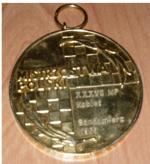
Fot. 38. Awers złotego medalu Małgorzaty Wiese w Indywidualnych Mistrzostwach Polski w Sandomierzu w 1985 roku

Turniej przebiegał w sympatycznej i serdecznej atmosferze. Obok dobrej organizacji, nad całością imprezy czuwał prezes OZSzach w Tarnobrzegu, K. Wiszniowski 807 .