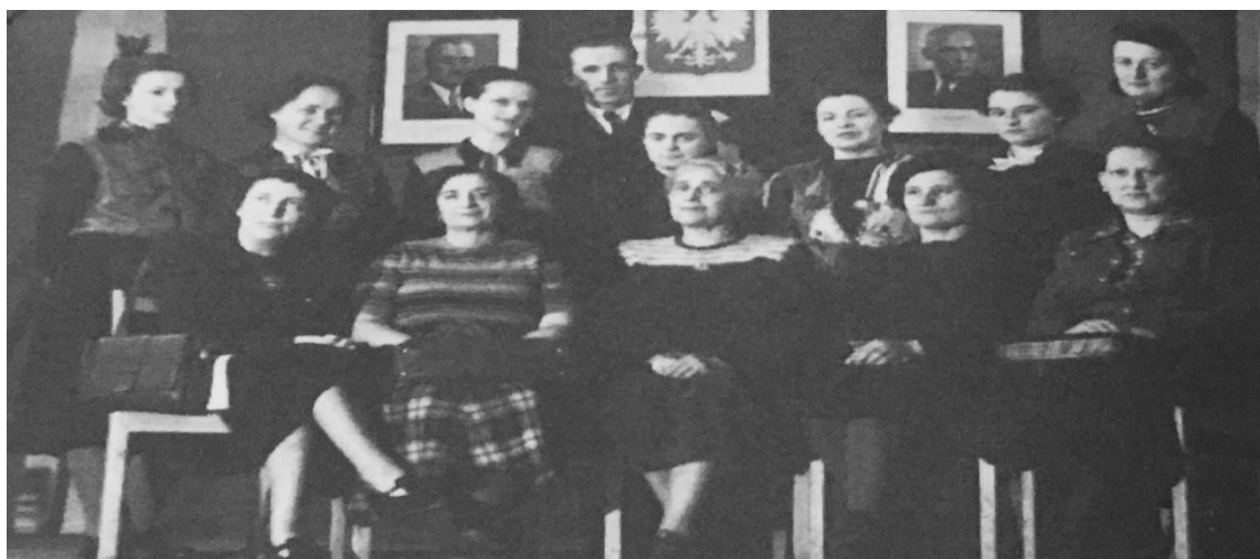
Fot. 16. Uczestniczki turnieju o tytuł Mistrzyni Polski w Częstochowie w 1951 roku

skórzane; dziesiąte – kupon materiału na bluzeczkę, jedenaste – piżama i dwunaste – kupon materiału na bluzeczkę 415 .