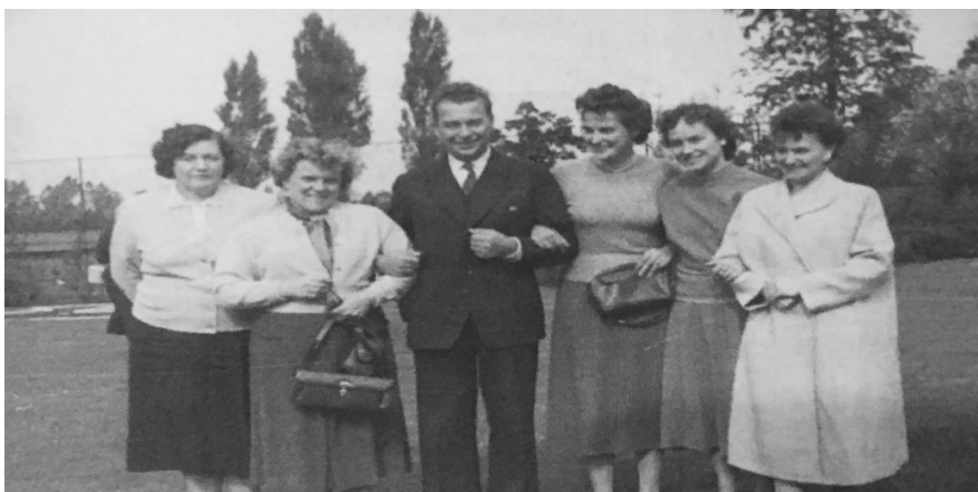
Fot. 18. Reprezentantki Polski i ZSRR w towarzystwie mieszkańców Emmen