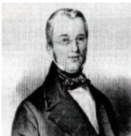
Fot. 5. Aleksander Pietrow

W 1840 roku do Warszawy przybył znany rosyjski mistrz Aleksander Pietrow, który objął stanowisko w carskiej administracji i bardzo przyczynił się do wzrostu poziomu gry na warszawskich salonach.