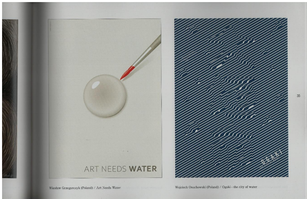
Wiesław Grzegorzycy (Poland) / Art Needs Water