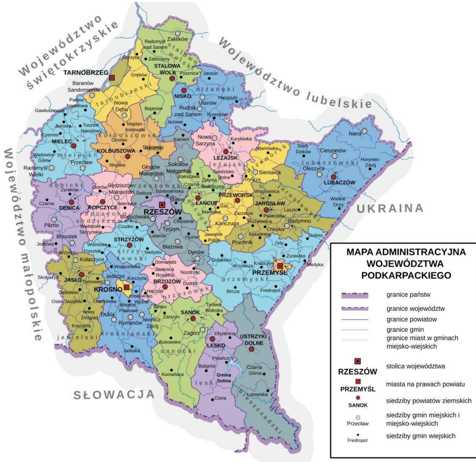
Rysunek 1. Mapa województwa podkarpackiego