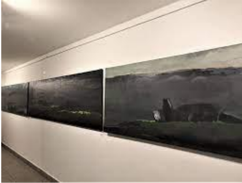
Foto z wystawy/ Pejzaże horyzontalne /Galeria Sztuki Współczesnej Korekta w Warszawie