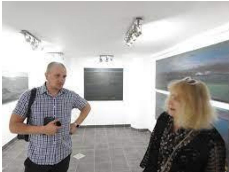
Foto z wystawy/ Pejzaże horyzontalne/Galeria Sztuki Współczesnej Korekta w Warszawie