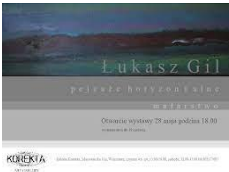
Plakat z wystawy/ Pejzaże horyzontalne /Galeria Sztuki Współczesnej Korekta w Warszawie

Wystawa koncentruje się na obrazowaniu problematyki kondycji współczesnego człowieka. Artysta ukazuje ascetyczną stronę światła, jego samotność, która jest stanem duchowej tajemnicy. Ono jest szczeliną, kierunkiem wyjścia z przemienności form, od chaosu i cierpienia świata ku zbawczej transcendencji. Obraz pt. „Pejzaż horyzontalny III” został włączony do znaczącej międzynarodowej kolekcji zbiorów Galerii Sztuki Współczesnej KOREKTA w Warszawie. Druga odsłona ekspozycji prac miała miejsce w BWA w Rzeszowie.