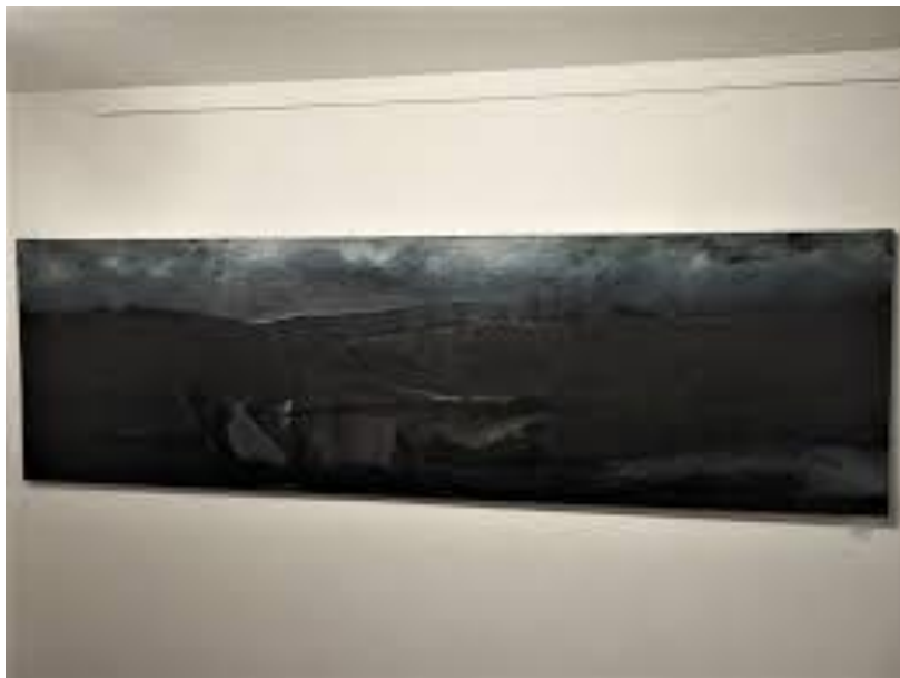
Foto z wystawy/ Pejzaże horyzontalne/Galeria Sztuki Współczesnej Korekta w Warszawie