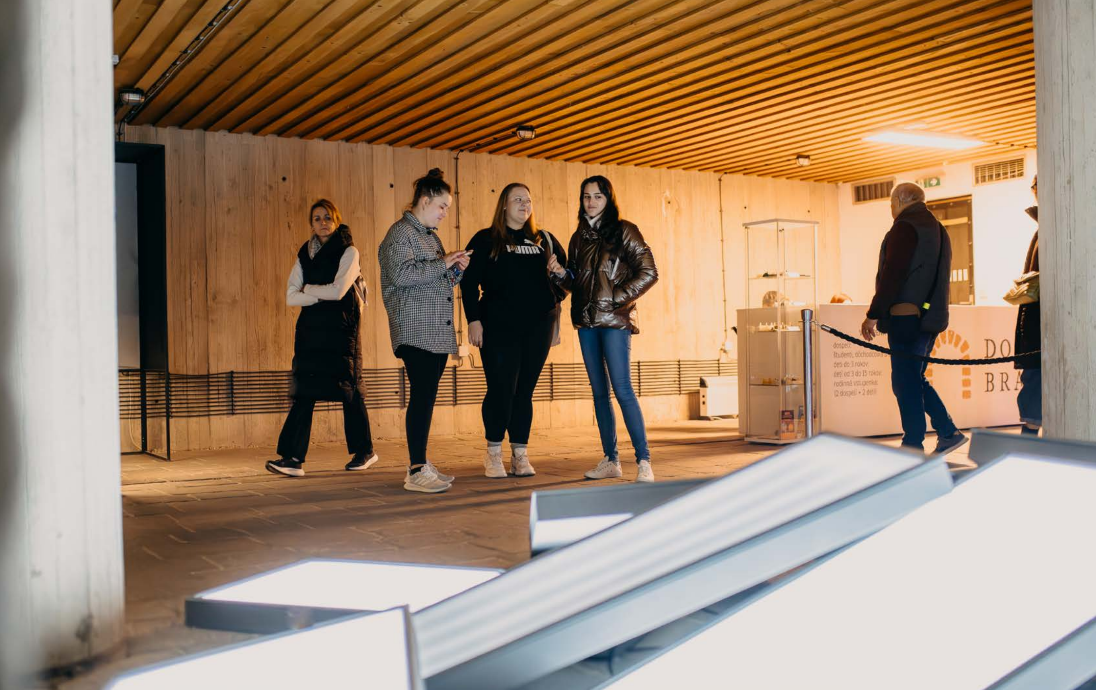
Instalacja świetlna Próżnota