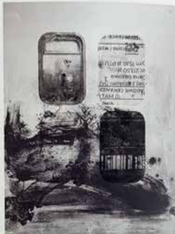
Itinerary VII , autooffset, przedruk anastatyczny na blasze aluminiowej, 103x79 cm, 2025