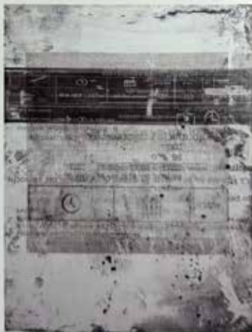
Itinerary VIII , autooffset, przedruk anastatyczny na blasze aluminiowej, 103x79 cm, 2025