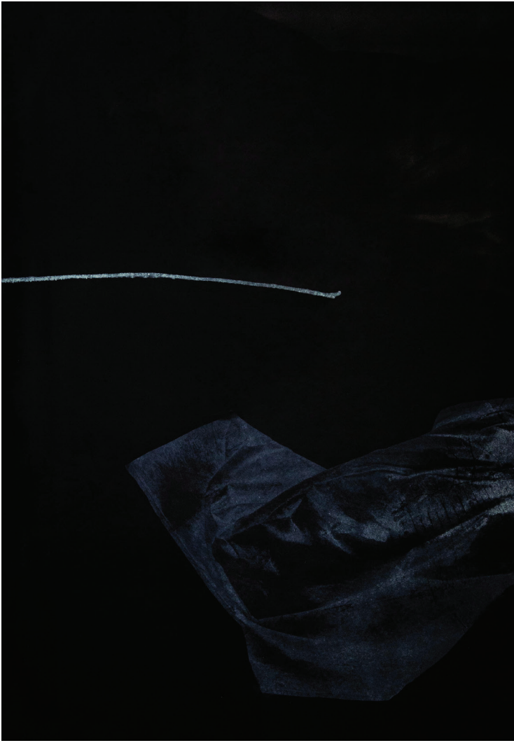
configuration xxy-4 8th Graphic Art Biennial of Szeklerland