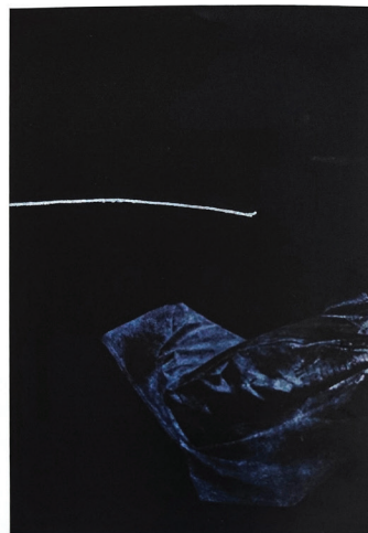
Dominika Surmacz / PL Configuration xxy-4 / Konfiguráció xxy-4 / Configurație xxy-4 Lithography, mixed technique / Litografie, vegyes technika Litografie, tehnică mixtă 70 x 100 / 2022