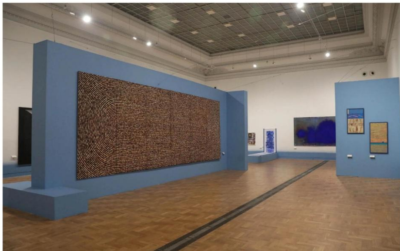
Wystawa "Pejzaż malarstwa polskiego"