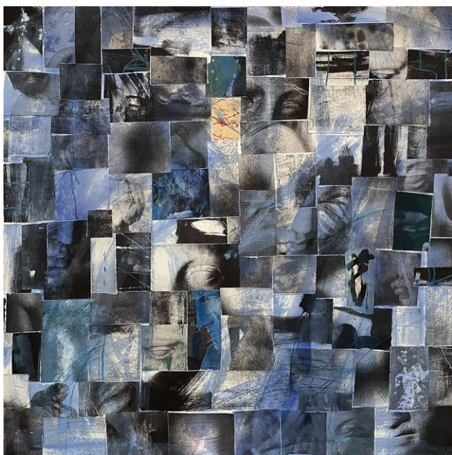
Notebook I, technika mieszana na papierze, 100x100cm, 2024