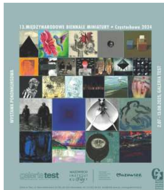
Wystawa Galeria Test/ Warszawa