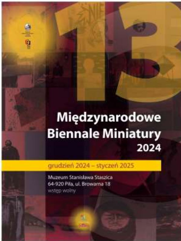
Wystawa Muzeum Stanisława Staszica w Pile