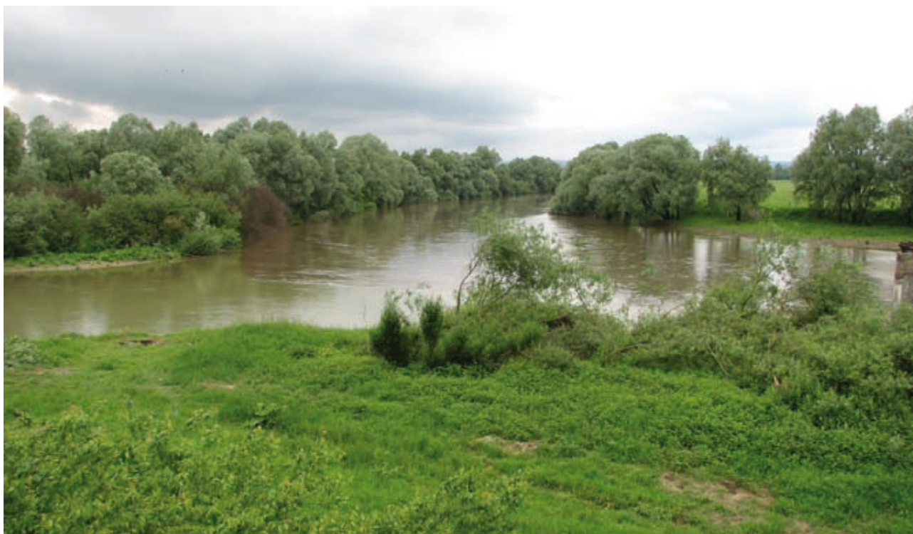
Ryc. 1. Górny Dniestr (przy ujściu Stryja).

I – górny odcinek biegu rzeki (mniej więcej do wysokości dzisiejszego Iwano-Frankowska), należący do krainy fizyczno-geograficznej Karpat i Za-