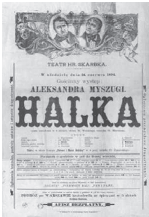
Fot. 3. Afisz teatralny: Halka opera narodowa w 4 aktach , słowa W. Wolskiego, muzyka St. Moniuszki