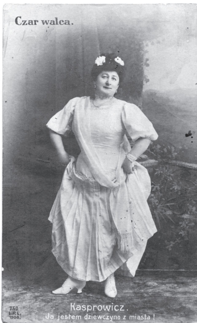
Fot. 7. Fotografia A. Kasproiczowej z 1906 r.