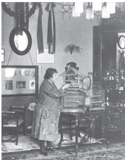
Fot. 10. Śpiewaczka Amalia Kasprovicz karmiąca kanarki w swoim mieszkaniu, 1927 r.