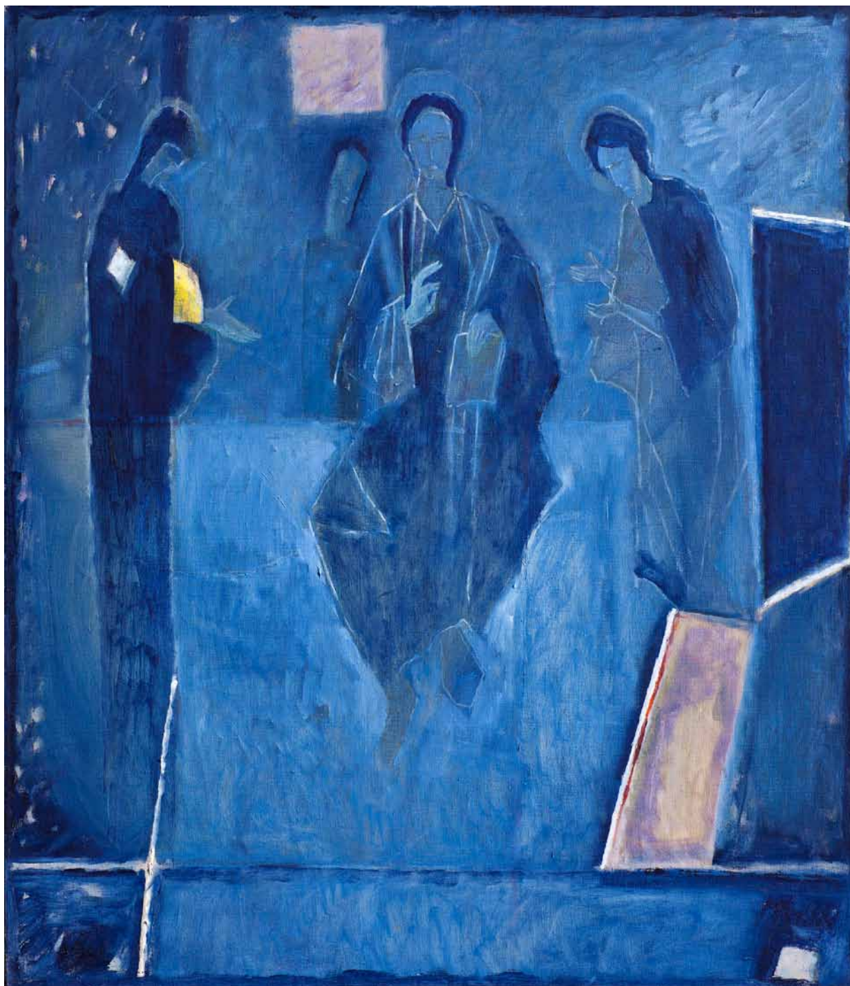
3. Stanisław Białogłowicz, Deesis , olej, płótno, 140x120, 2005