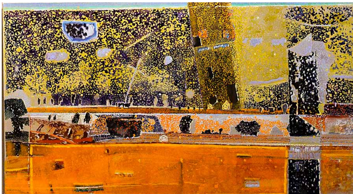
5. Stanisław Białogłowicz, Pejzaż , olej, płótno, 100x180, 2023