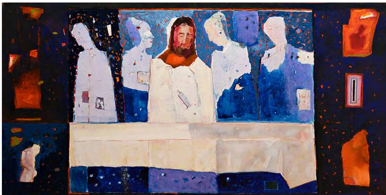
6. Stanisław Białogłowicz, Wieczerza w Ermoupoli , olej, płótno, 100x180, 2012