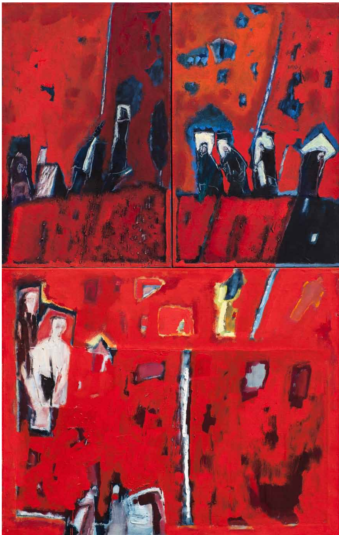
2. Stanisław Białogłowicz, Znaki Oczyszczenia , olej, płótno, 160x100, 2007, własność Muzeum Narodowego w Gdańsku