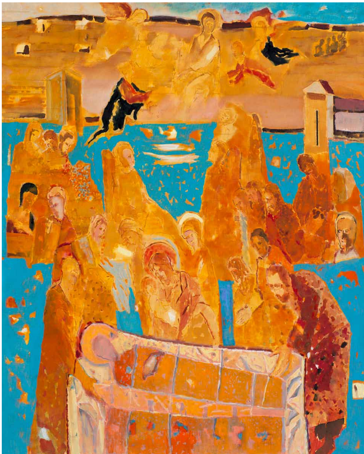
4. Stanisław Białogłowicz, Zaśnięcie Marii w Ermoupoli , olej, płótno, 160x130, 2013