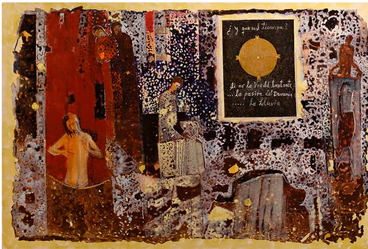
8. Stanisław Białogłowicz, Pewność w Niepewności , olej, płótno, 100x180, 2023