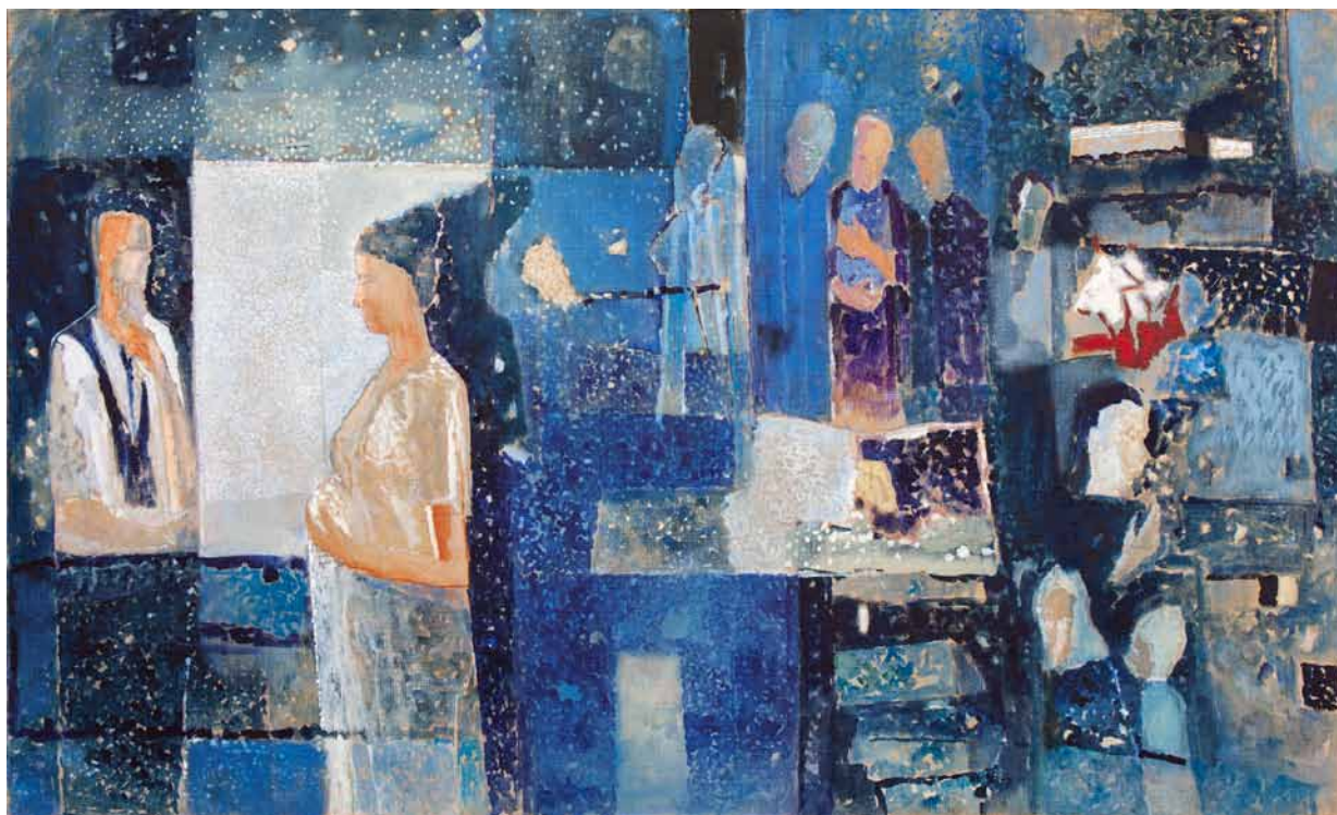
1. Stanisław Białogłowicz, W Pracowni , olej, płótno, 120x200, 2005