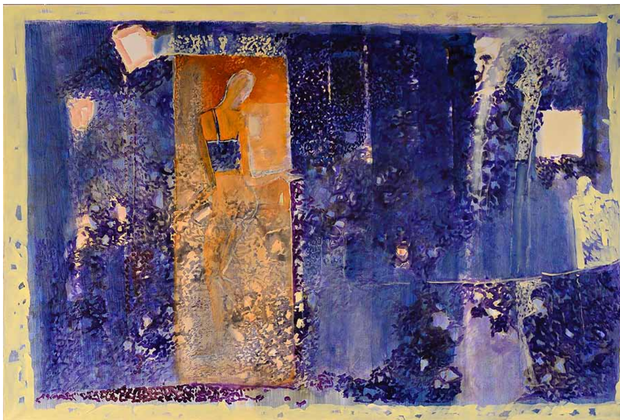
7. Stanisław Białogłowicz, Chwila po Chwili , olej, płótno, 100x180, 2023