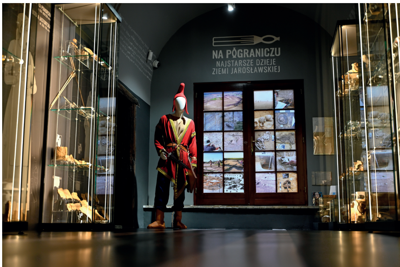
Ryc. 3. Wystawa stała „Na pograniczu... Najstarsze dzieje ziemi jarosławskiej” w Muzeum w Jarosławiu Kamienica Orsettech z widocznym logotypem ekspozycji. Po lewej stronie manekin z zrekonstruowanym strojem i wyposażeniem wojownika scytyjskiego kręgu kulturowego.