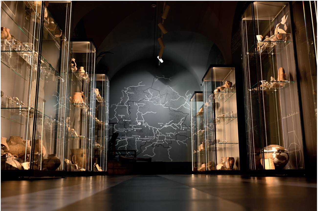
Ryc. 2. Wystawa stała „Na pograniczu... Najstarsze dzieje ziemi jarosławskiej” w Muzeum w Jarosławiu Kamienica Orsettich.