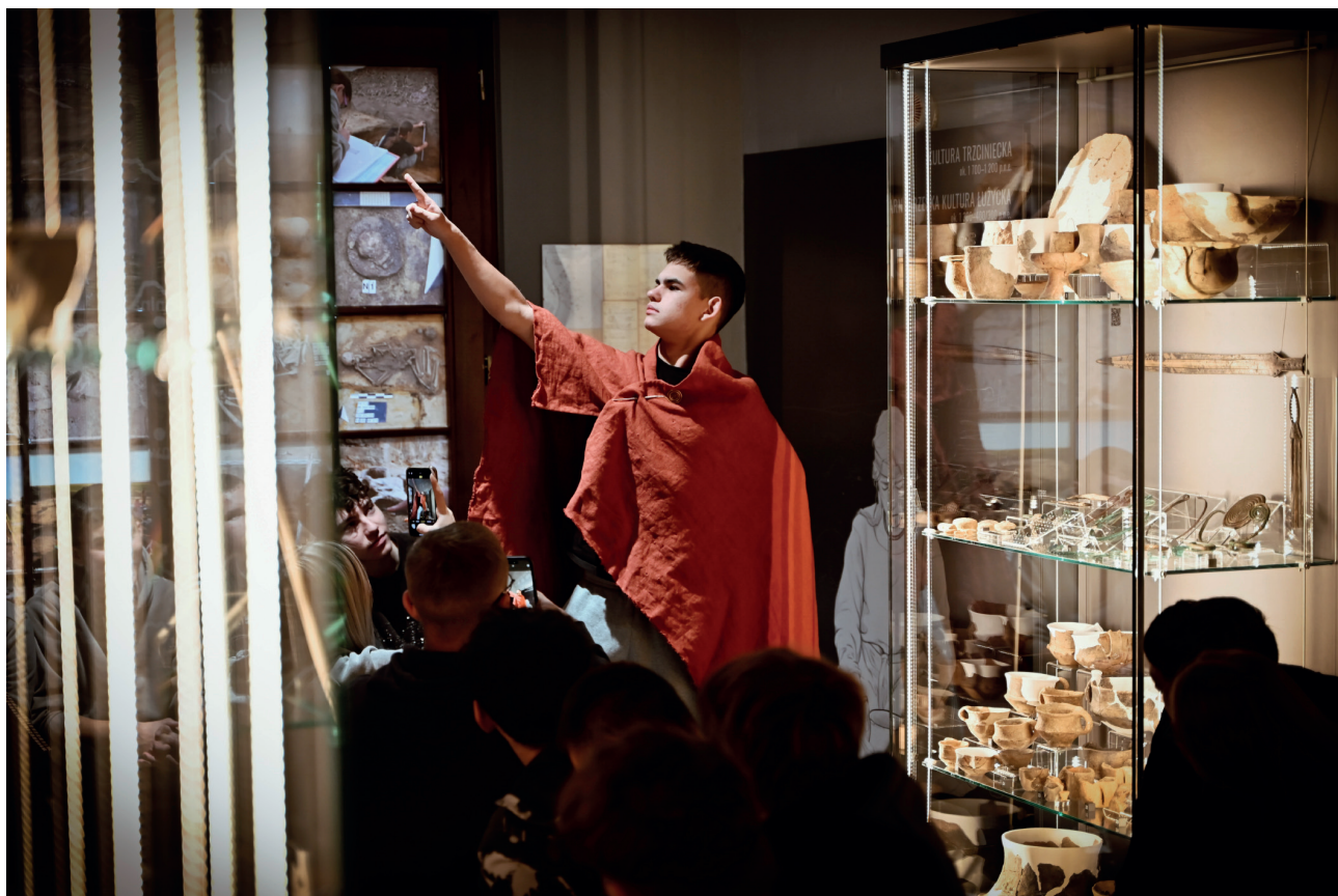
Ryc. 4. Uczniowie podczas jednej z lekcji muzealnych prowadzonych na wystawie. Fig. 4. School students during one of the museum lessons carried out at the exhibition.

ciepłym przyjęciem, zarówno w środowisku specjalistów, jak i osób zainteresowanych archeologią. Wśród zalet ekspozycji często wymieniano fakt twórczego wykorzystania niewielkiej przestrzeni do zwięzłego przedstawienia specyfiki najważniejszych zjawisk kulturowych omawianych okresów. Zwiedzającym przypadła do gustu również autorska szata graficzna oraz sposób ekspozycji zabytków w gablotach.