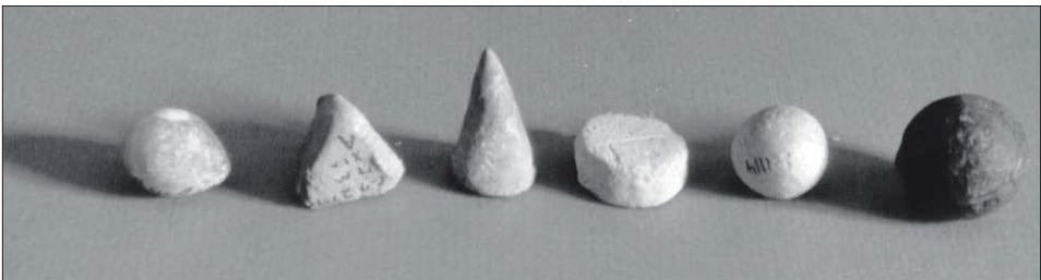
Fot. 1. Tokeny obrazujące produkty. Czworościan przedstawia jednostkę pracy

Jednostkę pracy (podstawową) wyznacza czworościan foremny przedstawiony na fot. 1 umieszczonej za zgodą autorki – prof. Denise Schmandt-Besserat. Fot. 1 ukazuje proste tokeny z obecnego Iraku, około 4000 lat p.n.e. Stożki, kulki i dyski przedstawiają różne miary zboża, czworościan reprezentuje jednostkę pracy.