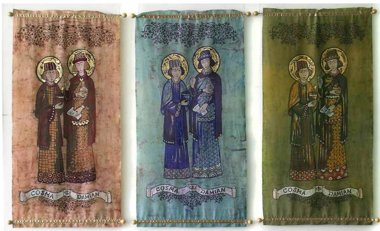
2. Natalia Odój, Kosma i Damian , 2009, batik na płótnie, złocenie