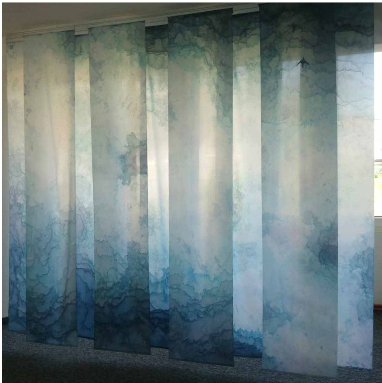
16. Maria Wrona, Nieboskłon , 2018, kompozycja przestrzenna, fot. M. Wrona