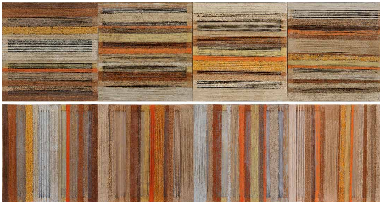
14. Nikole Dybowski, Siewca , 2014, technika własna, propozycje układów kompozycyjnych