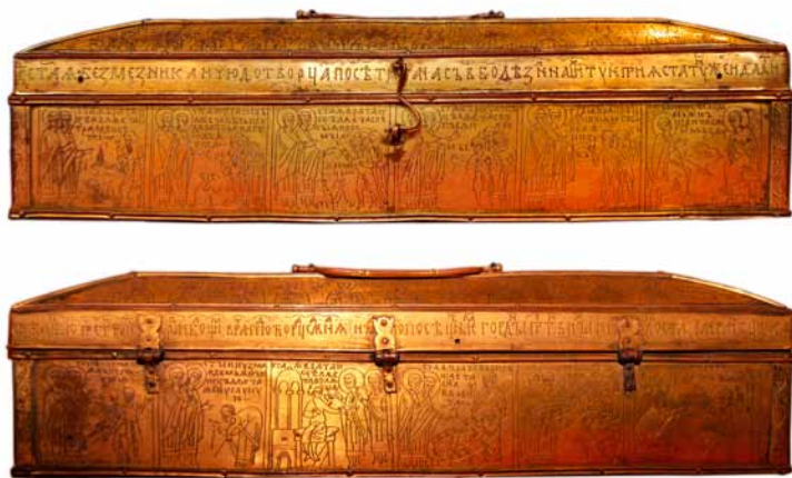
5. Relikwiarz świętych Kosmy i Damiana, kościół Najświętszej Marii Panny w Krakowie