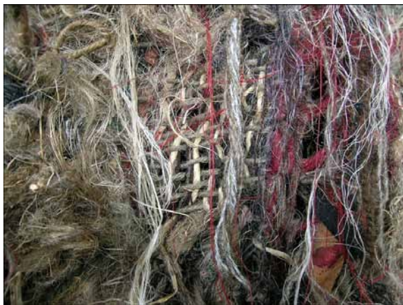
18. Olga Gralewska, Oto człowiek , 2009, technika własna – detal splotów