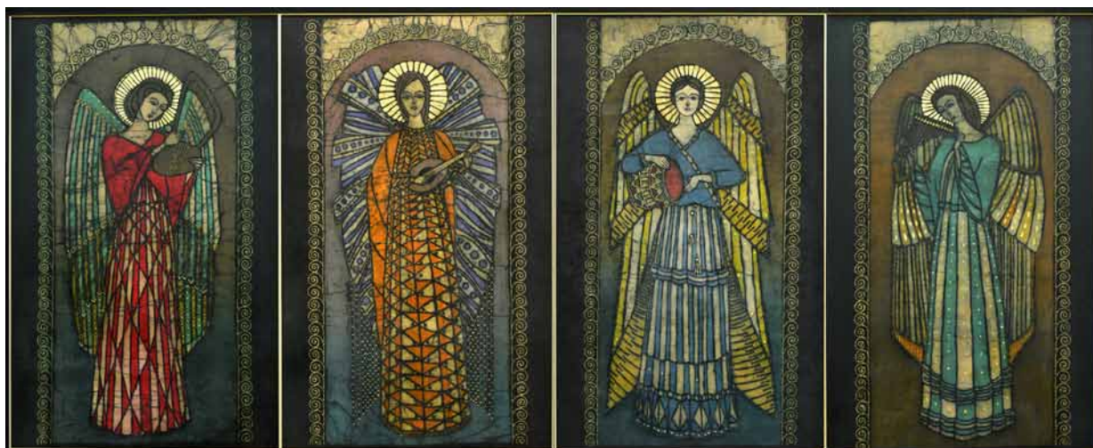
1. Arleta Bortnik, Anielski kwartet , 2015, batik na płótnie, fot. A. Bortnik