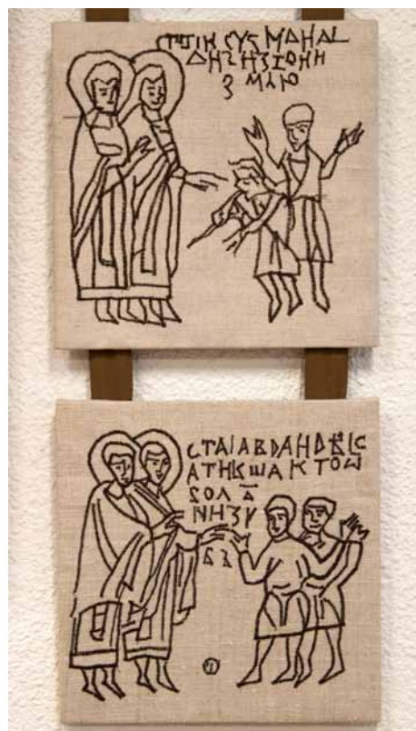
6. Adrianna Sudoł, Sts Cosmas and Damian , 2011, two panels with a close-up of machine embroidery on linen, photo by M. Kierczuk-Macieszko

character of the angular line which the goldsmith made on the antique reliquary in the soft copper sheet with the use of a modeler, the author chose the technique of machine embroidery with a zigzag stitch. The central plaque with white embroidery on a brown background is a color negative of the drawings on the side panels, made with brown thread on a gray canvas [fig. 6]. The composition follows the pattern of hagiographic icons, in which scenes depicting a saint's life, miracles and martyrdom are presented around the depiction of the saint. It is a pity that the student took over the pattern, but probably did not understand the message it carries. This is indicated by the "narrative" central scene, one of many on the reliquary, while Orthodox art would place there the image, i.e. the emanation, of a saint. In this edition, although visually interesting, the fabric resembles a comic book more than an icon that is supposed to lead to prayer. Undoubtedly, the poetics of the art of the Eastern Orthodox Church is attractive to young people, but imitation does not entail the need for in-depth reflection on the theological essence of the icon.