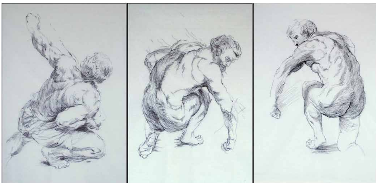
9. Anna Kłys, Nitką rysowane , 2011, haft na tiulu