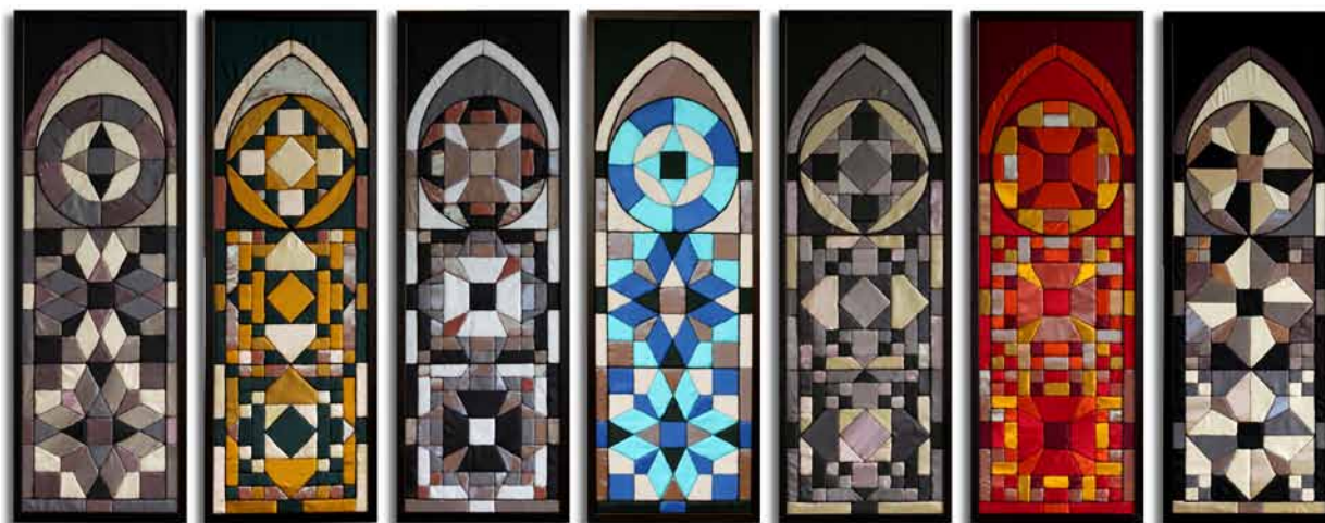
12. Anna Guz, Kalejdoskop , 2011, siedem prac w technice aplikacji