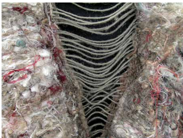
19. Olga Gralewska, Oto człowiek , 2009, detal – osnowa i sploty