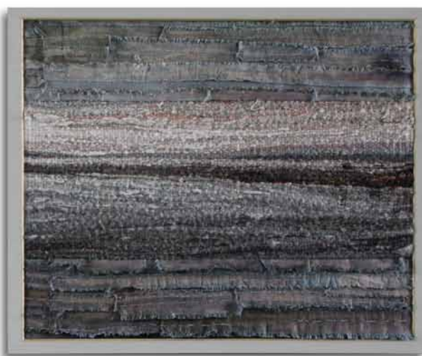
15. Renata Kamińska, Szara godzina , 2012, dyptyk, gobelin z bordiurą z pasów lnianego, barwionego płótna