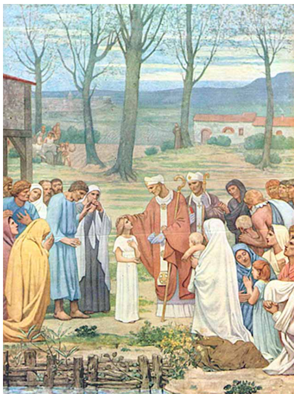
3. Pierre Puvis de Chavannes, Spotkanie świętej Genowefy z Świętym Germain z Auxerre i świętym Loup z Troyes , 1878, Panthéon, Paryż, 1878, ilustracja zawarta w: Maurice Denis, Histoire de l'art religieux , Paris, Flammarion, 1939

3. Pierre Puvis de Chavannes, The Meeting of Saint Genevieve with Saint Germain of Auxerre and Saint Loup of Troyes , 1878, Panthéon, Paris, 1878, illustration included in: Maurice Denis, Histoire de l'art religieux , Paris, Flammarion, 1939