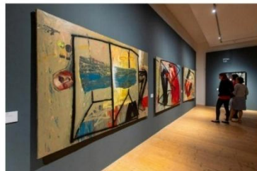
Výstava Necenzurováno – polské nezávislé umění 80. let (GASK)

Oranžová alternativa uspořádala řadu svérázných happeningů, namátkou třeba Kdo se bojí toaletního papíru, Vigilie říjnové revoluce či Stalinův pohřeb aneb pohřeb sobě. Happeningy, při kterých mladí lidé protestovali proti odvodům do armády tím, že v kartonových maketách tanků inscenovali pouliční bitvy.