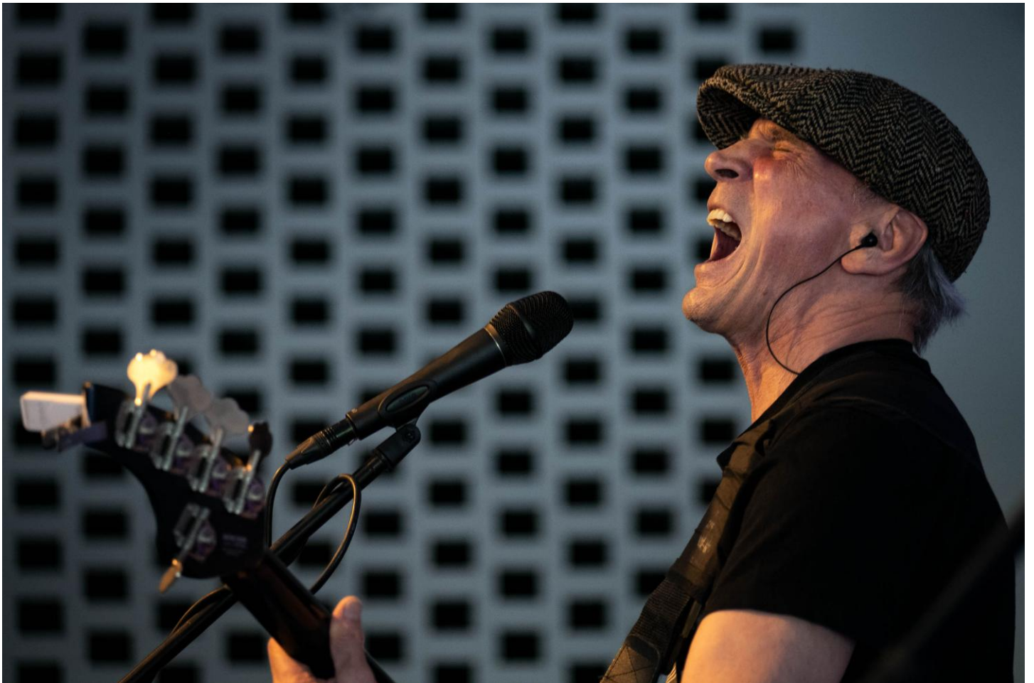
Wernisaż uświetnił koncert Lecha Janerki.