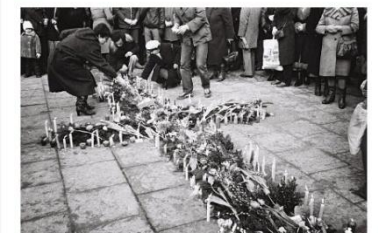
Kříž z květin, Krakov, Jesuitští kostel, 1982

Výstava Necenzurováno je pokus ukázat fenomén polského nezávislého kulturního hnutí osmdesátých let. Expozice v Galerii Středočeského kraje představuje sedm tematických okruhů, jejichž označení čerpá z názvů významných nezávislých výstav osmdesátých let nebo důležitých uměleckých děl z této doby (Dusno, Oranžová alternativa, Kufrová výstava, Večeradlo, Dřina, Květinový kříž, Proti zlu, proti násilí, Znamení kříže, Věžerský obrazek, Vztekající pes na zeleném pozadí).