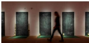
Výstava Necenzurováno – polské nezávislé umění 80. let (GASK)

Doslova i přeneseně. Sobocki měl s onou „rudou kůží“ jistě dost zkušeností, již v 60. letech patřil ke skupině Wprost, sdružující kritiky režimu, přičemž na všechny dopadaly podobné represe jako na obdobně smýšlející umělce v Československu.