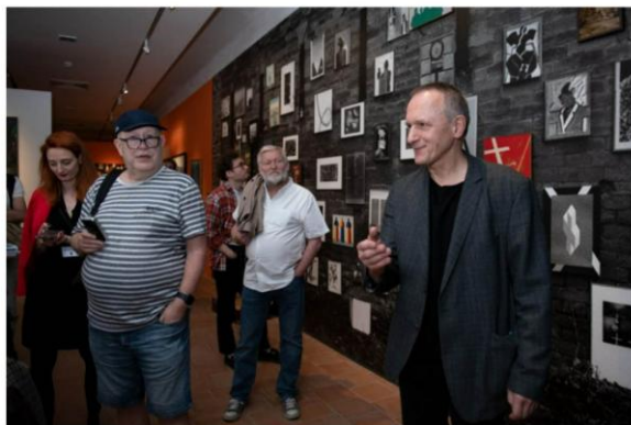
Výstava Necenzurováno v kutnohorské galerii GASK, komentovaná prohlídka

Polští umělci bojovali proti brutálnímu režimu nejrůznějšími formami, nejen podobenstvími a historickými paralelami ve výtvarném umění a na divadle, satirickými plakáty a verši, květinovými kříži na veřejných prostranstvích, ale i originálními happeningy: „podpisem“ členů opoziční Oranžové alternativy byli trpasličí namalovaní na zdech. Objevovali se většinou na místech, kde před tím tajná policie zamalovala opoziční hesla. Oranžoví trpasličí se stali noční můrou tajných, protože: jak bojovat proti těmto neexistujícím? bytostem a nezesměšnit se? Existence oranžových trpaslíků je – bohužel – důležitá i v současném světě.