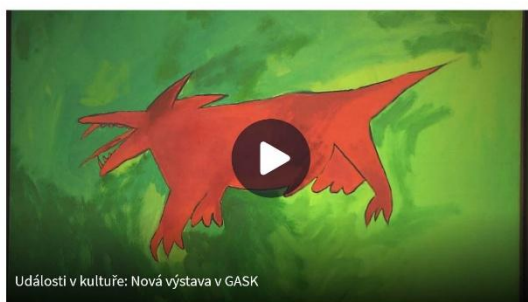
Události v kultuře: Nová výstava v GASK

Výstava polského nezávislého umění osmdesátých let dvacátého století nabízí díla téměř šedesátky polských umělců, kteří bojkotovali kulturní politiku komunistických orgánů Polské lidové republiky po zavedení stanného práva v roce 1981. Výstava byla poprvé představena loni v Centru současného umění – Zámek Ujazdowski. Nyní jde o reprízu.