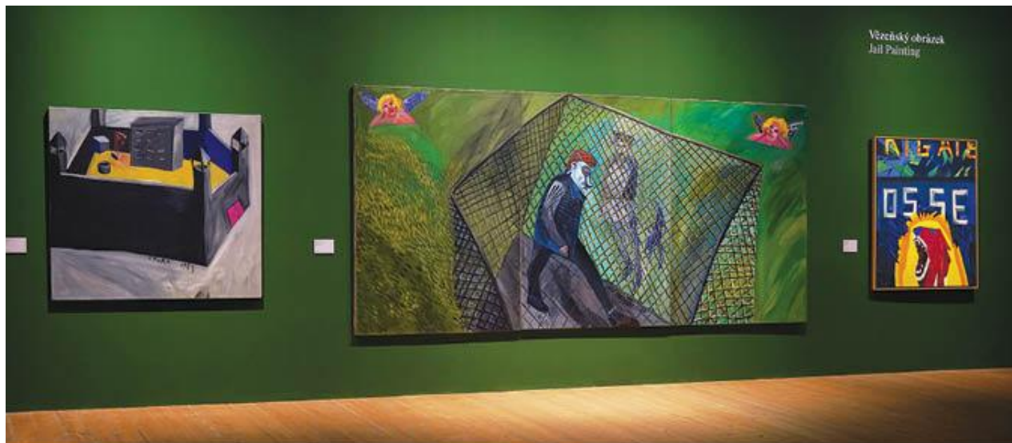
Wczesny obrazek Jai Painting

la Zygmunta III na temat kobiety upadłej na duchu, w której autor zestawil dwa symbole Warszawy w prowokacyjną narrację. Na kolejnych ścianach możemy zobaczyć dwa niechlujnie malowane, ekspresyjne obrazy Zbigniewa Dowgiałły epatujące cielesnością i seksem, a także tytułowy, monumentalny obraz Jacka Sroki pt. Obrazek więzienny , który ukazuje opozycjonistę w pilnowanej przez milicjanta klatce, osadzonej w sielskim pejzażu, ze spoglądającymi z góry aniołkami niczym w ludowym, świętym obrazku. Obok wisi inny obraz tegoż autora symbolicznie ukazujący więzienie w Pińczowie, w którym, po wprowadzeniu stanu wojennego, duża liczba opozycjonistów była internowana. W sali tej możemy zobaczyć obraz Ewy Ciepielewskiej Brigade Rosse , w którym autorka przypomina „dwie oblicze” anarchistycznej, skrajnie lewicowej włoskiej organizacji terrorystycznej Czerwone Brygady.