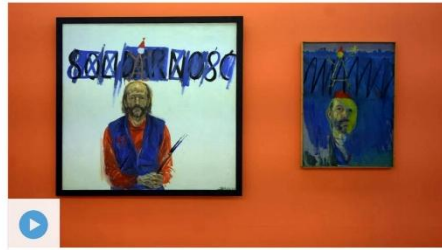
Uncensored: Polish independent art of 1980s on display in Kutná Hora Length of audio: 7:08

An exhibition presenting an overview of independent Polish art of the 1980s got underway in Gallery of the Central Bohemian Region this week. Called Uncensored, it presents the Polish equivalent of the post-1968 Czech underground art scene. I discussed the exhibition with one of its curators, Richard Drury: