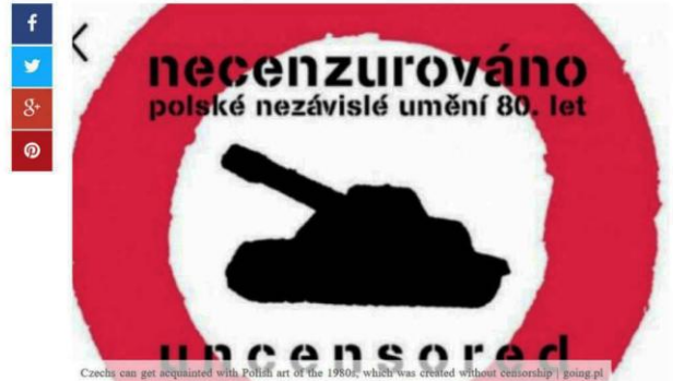
Czechs can get acquainted with Polish art of the 1980s, which was created without censorship | going.pl

A review exhibition of Polish independent art of the 1980s – “Uncensored” – was opened on Saturday in the Srodkowoczeska Gallery in Kutna Hora, approx. 65 km from Prague. It presented the works of about 60 artists who boycotted the cultural policy of the communist authorities and created engaged art.