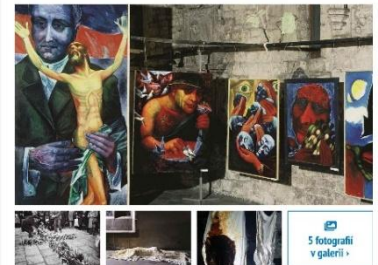
Obrazy Eugeniusze Machy

/FOTO, VIDEO/ Galerie Středočeského kraje (GASK) otevře 27. května unikátní průřezovou výstavu polského nezávislého umění 80. let 20. století - Necenzurováno. Jde o představení polského ekvivalentu tehdejší české neoficiální výtvarné scény, reagující na realitu Solidarity a výjimečného stavu (1981-1983).