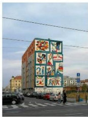
Czech-Polish Mural in Prague Holešovice

Would you say the situation in which the Polish artists found themselves in the 1980s was similar to that in Czechoslovakia at the time?