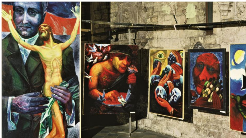
Jedním z mnoha vystavených děl jsou obrazy, jejichž autorem je Eugeniusz Mucha.