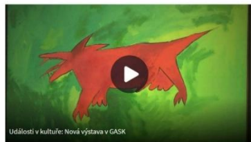
Události v kultuře: Nová výstava v GASK

Jak ale vyplyvá s už zmíněného poselství výstavy Necenzurováno: Žádná moc, byt sebebrutálnější, nemůže všechny zadupat.