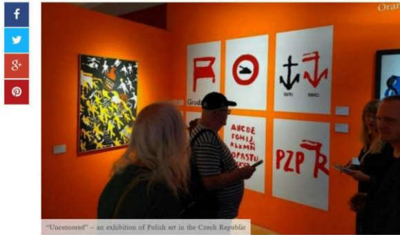
“Uncensored” – an exhibition of Polish art in the Czech Republic

Kutná Hora is an hour's drive from Prague, a gem of medieval and baroque architecture. It is also the seat of one of the most important art galleries in the Czech Republic – the Central Bohemian Gallery GASK, located in the historic complex of the former Jesuit college. On May 27, the largest exhibition of Polish art in the Czech Republic opened in this place for several years.