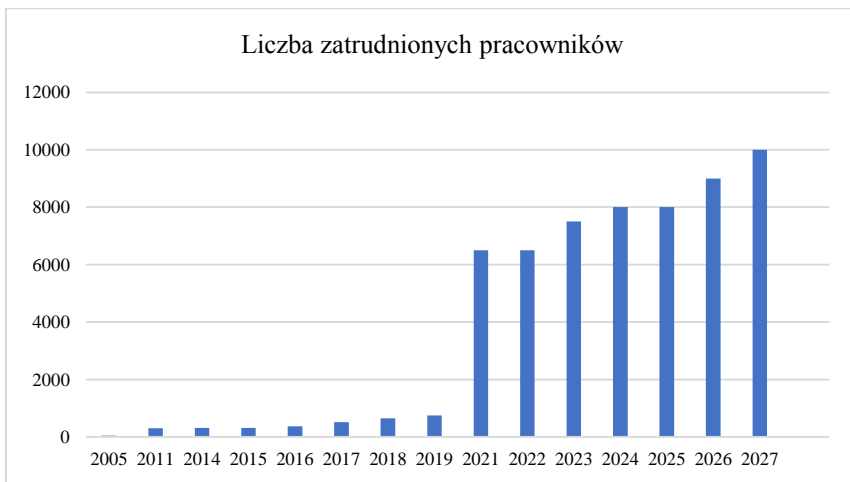
Wykres 1. Dynamiczny wzrost kadrowy Fronteksu w latach 2005–2027

Zwiększenie zakresu obowiązków wiąże się również z poszerzeniem możliwości operacyjnych i ekonomicznych. Wykres 1 ukazuje okres od 2005 do 2027 roku, czyli od początku działalności Fronteksu, aż po szacowane zmiany, do których ma dojść w najbliższych kilku latach. Dane zawarte na tym wykresie obrazują liczbę pracowników, którymi dysponowała Agencja w pierwszych latach swojego istnienia, podczas rozkwitu kryzysu migracyjnego, jak i prognozowaną ich liczbę w najbliższych sześciu latach, co do których planowany jest rozkwit struktury Straży. Wykres 2 odzwierciedla natomiast wysokość rocznego budżetu operacyjnego Fronteksu, ukazując jego dynamiczny wzrost.