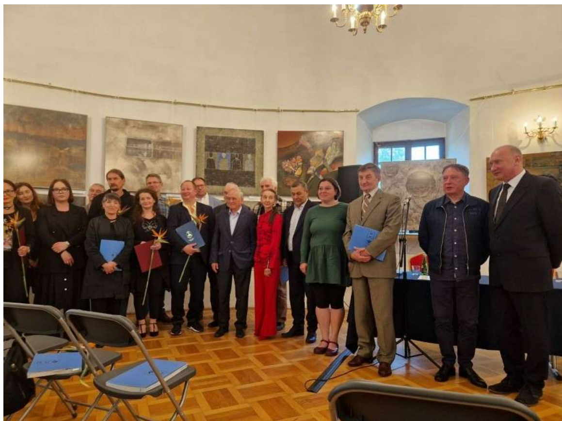
Gala Nagród Triennale Srebrny Czworokąt 2024 w Galerii ARP na Zamku w Kraszynie - 11.05.2024 r.

Do udziału w pracach jury (dwuetapowe) zapraszani są uznani artyści i historycy sztuki reprezentujący różne środowiska artystyczne z kraju i zagranicy. Zaplanowano cykl ekspozycji wystawy głównej. Na ekspozycji głównej Triennale w Galerii ARP, Zamku w Kraszynie pokazano 113 prac 72 autorów z 5 krajów .