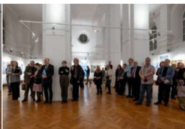
Srebrny Czworokąt 2024 w BWA w Rzeszowie, wernisaż - 23.01.2025 r.