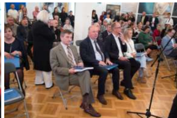
Gala Nagród Triennale Srebrny Czworokąt 2024 w Galerii ARP na Zamku w Krasicy - 11.05.2024 r.

GRAND PRIX - Nagroda Ministra Kultury i Dziedzictwa Narodowego jest główną nagrodą w organizowanym cyklicznie od 30 lat przez Galerię Sztuki Współczesnej w Przemyślu we współpracy ze znaczącymi ośrodkami zagranicznymi, konkursie. Przyznawana za bardzo wysoki poziom artystyczny zgłoszonych prac i oryginalne odniesienie się do tematu przewodniego. Nagroda obejmuje m.in. organizację indywidualnej wystawy prac artystki w Muzeum Historii Miasta Przemyśla podczas kolejnej (13) edycji Triennale oraz włączenie obrazu do Zbiorów Galerii.