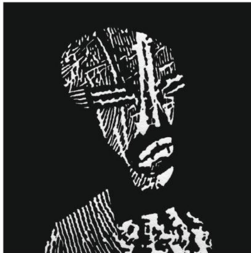
Postać czasu - 61, 2024, linoryt, 10 x 10 cm

Autor za swoje prace pt. „Postać czasu – 61” otrzymał: Second prize of the Graphic section.