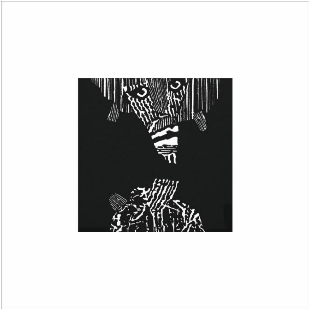
Postać czasu - 63, 2024, linoryt, 10 x 10 cm

Międzynarodowe Biennale Sztuk Miniaturowych Timisoara 2024 Mikromundos - małe wszechświaty w małych formatach START online 05 lipca 2024 o godz. 14:00