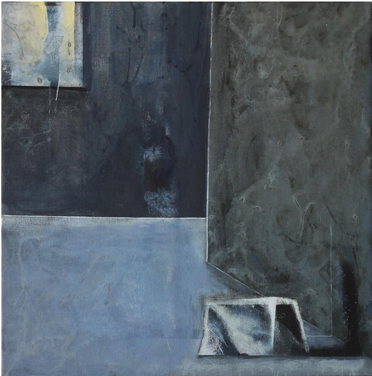
Łukasz Gil/ Ołtarz pokory I , olej na płótnie o formacie 100x100cm z 2021 roku